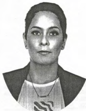
Colegio de Estudios Avanzados de Iberoamérica

DOCTORA EN ADMINISTRACIÓN Y DESARROLLO EMPRESARIAL