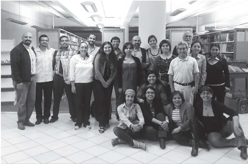
Foto 2. Primera generación y profesores del diplomado en sustentabilidad para la vida.