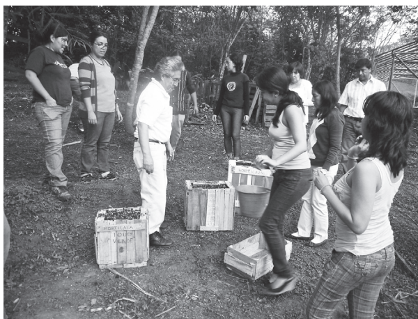
Foto 1. En contacto con la tierra, el sentir y el pensar.

Los diplomantes egresados de esta primera experiencia fueron quince. Nos dimos cuenta de cuánto valor y esfuerzo suscita tener una actitud de atender y cultivarnos como seres humanos cuidadosos de sí y del mundo.