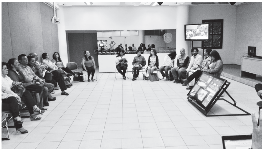
Foto 1. Sesiones a través de videoconferencia a las distintas regiones universitarias.