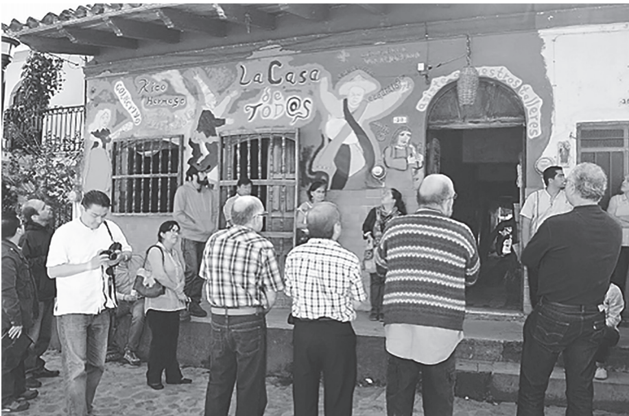
Foto 4. Fachada de la Casa de Tod@s, en 2014.

Entre los proyectos y las iniciativas que se han desarrollado están: la Casa de Tod@s (foto 4), la cual plantea crear entre toda la comunidad un lugar para que los jóvenes, en particular los xiqueños, tengan un espacio creativo donde se realicen eventos importantes y que sean positivos para la comunidad. Para ello, se han creado actividades como lectura de cuentos para niños, Círculo de Diálogo y cuidado del alma de las mujeres, así como algunos talleres de son jarocho para niños y adultos, percusiones, corte y confección, entre otros.