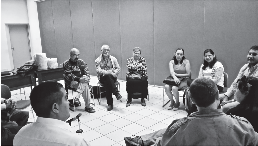
Foto 2. Sesión en la región Xalapa.