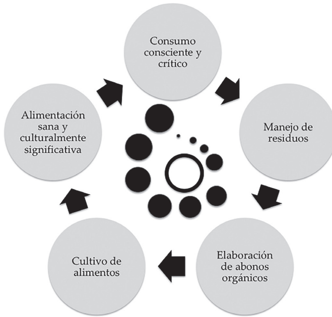
Figura 1. Proceso MIRE y sus cinco componentes. Elaboración propia.

Nutrida por una gran diversidad de personas: amas de casa, jubilados, estudiantes y maestros universitarios y de educación básica, con edades que oscilan desde los pocos meses de edad hasta los 72 años, se constituye la RAUPX como una oportunidad para hacer una reflexión colectiva sobre lo nocivo de los actuales hábitos de consumo y sobre la posibilidad de otra forma de alimentación, más sana, socialmente más justa y ambientalmente menos contaminante. El desarrollo de esta red busca no adaptarse a las condiciones desfavorables del entorno, sino transformarlas para reconfigurar una noción diferente sobre la alimentación. Intenta, asimismo, cambiar la relación tradicional de la universidad con las personas de su entorno, fomentando una interacción mucho más estrecha y activa, en que toda la comunidad modifica de manera radical su comportamiento y se erigen en protagonistas de la educación en todas sus dimensiones. Cuando las barreras entre la