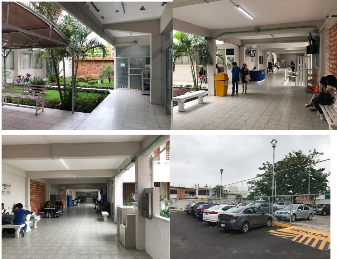
Imagen 10. Espacios de la subsede Veracruz

La infraestructura de la Facultad se distribuye en tres edificios (denominados A, B y C) de tres plantas cada uno y un estacionamiento para profesores y alumnos; en ellos se cuenta con salones, cubículos para profesores y espacios para el desarrollo de actividades académicas; además, en el Edificio A se ubican las oficinas administrativas, la Dirección y las jefaturas de Carrera. En cuanto a la Coordinación de Posgrado, esta se ubica en el Edificio C. Es importante hay que mencionar que en todos los edificios está disponible el acceso a la red inalámbrica de la Universidad Veracruzana y es posible conectar los equipos de cómputo o los dispositivos móviles a fuentes de energía eléctrica. Además, se continúa con la construcción de un cuarto piso en el Edificio C, el más cercano al estacionamiento, con el fin de contar con una mayor cantidad de espacios para la oferta educativa.