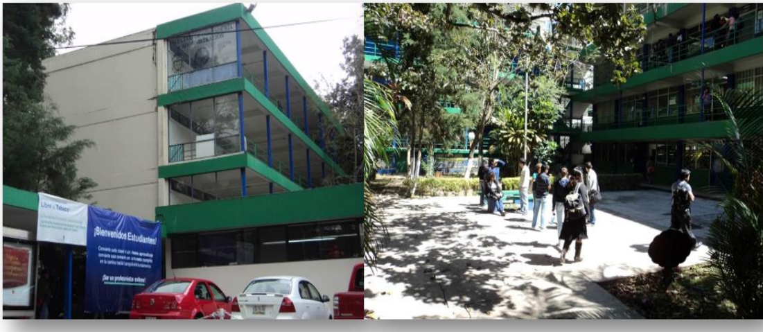
Imagen 1. Facultad de Contaduría y Administración

La sede en Xalapa, se oferta en la Facultad de Contaduría y Administración, campus Xalapa, la cual se localiza dentro de la zona Universitaria. Dispone de 5 edificios que contienen 40 aulas, servicios sanitarios en todos los edificios (imagen 1).