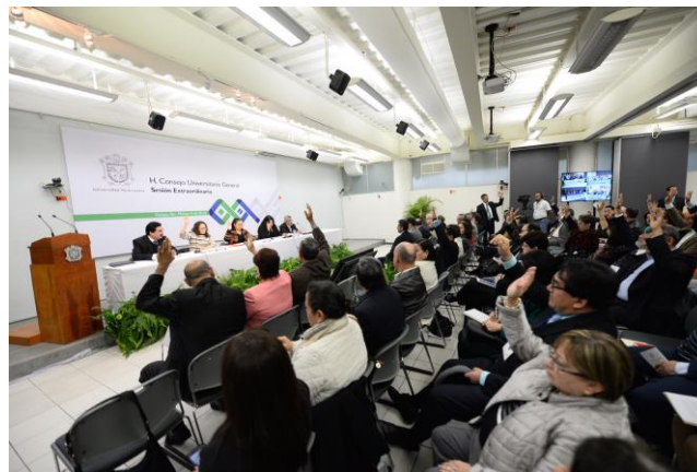
Imagen 5. Aula de Videoconferencia de la USBI Xalapa

En los diversos niveles de la USBI, se dispone de cubículos donde los estudiantes pueden estudiar o reunirse para hacer trabajo colaborativo. Allí mismo, se encuentra el Centro de Autoacceso para el aprendizaje de idiomas. En el sótano de la USBI, se cuenta con un aula de videoconferencia con capacidad de 300 personas (imagen 5).