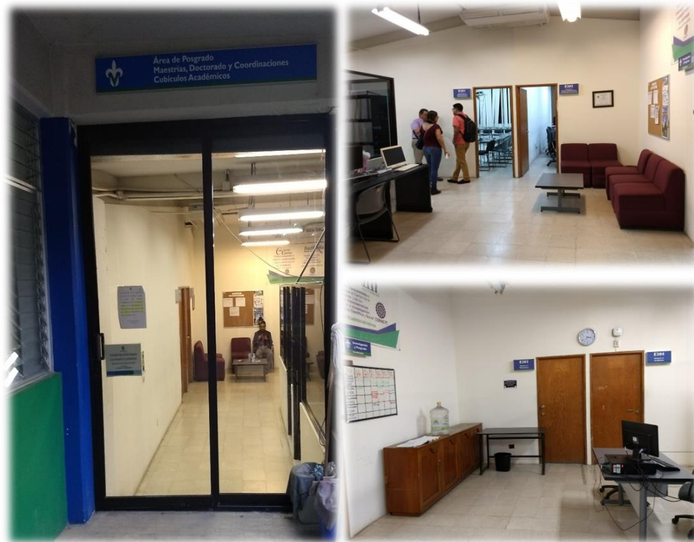
Imagen 3. Área de Posgrados