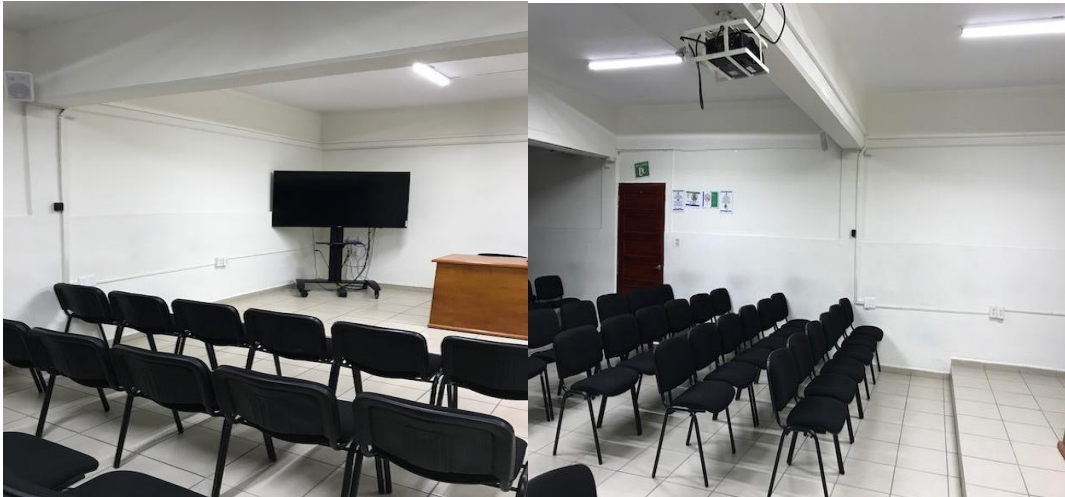
Imagen 14. Auditorio

Aunado a lo anterior, la Facultad cuenta con un auditorio con capacidad para doscientos asistentes, equipo de videoconferencias, televisión principal de pantalla plana con acceso a internet, dos televisores de apoyo para el público, proyector, equipo de sonido y tres aires acondicionados. Este espacio es importante ya que permite llevar a cabo conferencias, talleres o actividades similares de forma presencial o a distancia, las cuales complementan la formación de los estudiantes sin la necesidad de que éstos se desplacen hacia otras Facultades o puntos universitarios, logrando una gestión del tiempo más eficiente durante el periodo escolar; asimismo, el personal de la Coordinación y los Directivos de la Facultad lo ocupan para llevar a cabo sesiones informativas plenarias las cuales tienen lugar durante el proceso de admisión al posgrado, a lo largo del programa y la ceremonia de clausura.