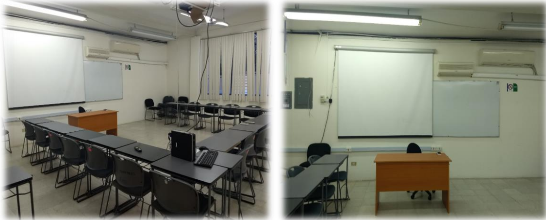
Imagen 4. Salón de clases de la EACE