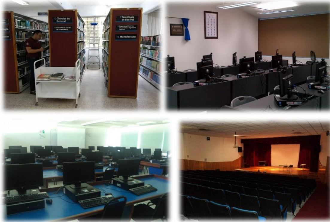
Imagen 2. Biblioteca, Aula ANFECA, Centro de Computo y Auditorio.