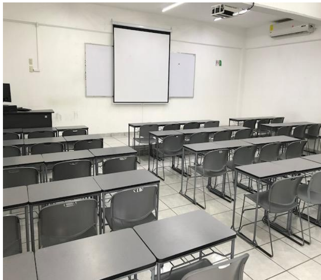
Imagen 13. Sala A

Sala A: ubicada en el primer piso del edificio C, ésta cuenta con la mayor capacidad ya que puede albergar hasta 48 estudiantes en mesas de trabajo individual; cuenta con dos aires acondicionados, computadora, proyector, pizarrón y acceso a Internet de punto fijo e inalámbrico.