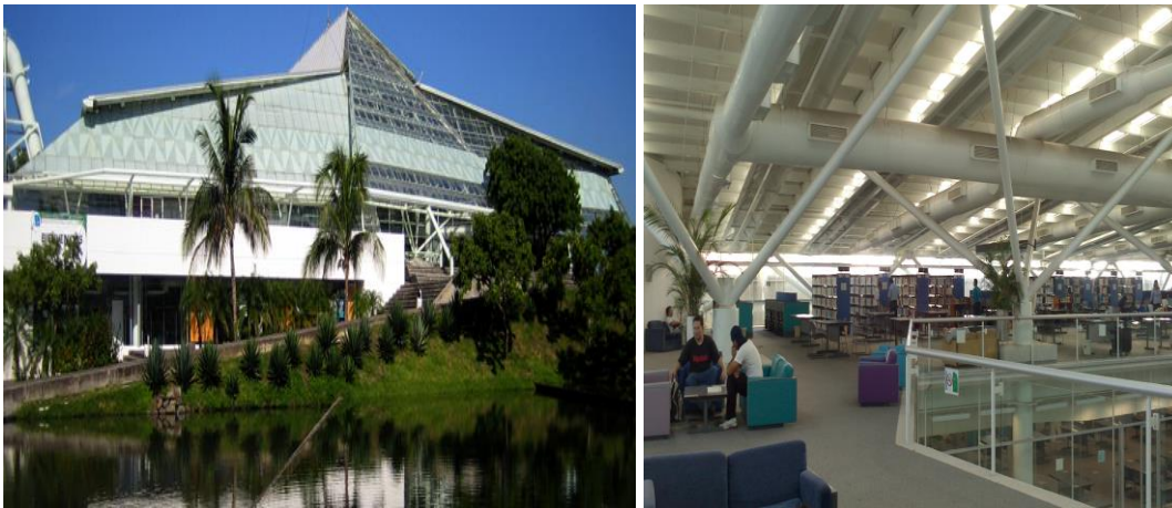
Imagen 19. USBI Boca del Río

de la Universidad Veracruzana. Tal como se menciona en el sitio web de la Universidad, el acervo de USBI-Veracruz cuenta con información multidisciplinaria que apoya de manera general a la oferta educativa que se imparte en las diversas facultades de la Universidad Veracruzana, en la región Veracruz. Los libros de todas las bibliotecas de la Universidad Veracruzana se pueden localizar por medio del catálogo en línea, al cual se tiene acceso por Internet. El usuario puede hacer búsquedas básicas y avanzadas por tema, autor, título, número de clasificación, principalmente. La biblioteca dispone de varios módulos con equipo de cómputo especialmente dedicado a la consulta de información del catálogo.