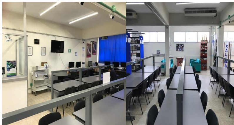
Imagen 16. Biblioteca

Respecto a los servicios bibliotecarios y acceso a bases de datos electrónicas, la Facultad cuenta con una Biblioteca con capacidad para cien estudiantes, los cuales pueden hacer uso de mesas de trabajo en equipo, individual, una sala de lectura y equipo de cómputo.