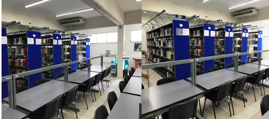
Imagen 17. Biblioteca y acervo

inalámbrica permite utilizar las bases de datos electrónicas a las cuales está suscrita la Universidad Veracruzana, lo cual amplía la gama de recursos para los profesores y estudiantes de la Especialización.