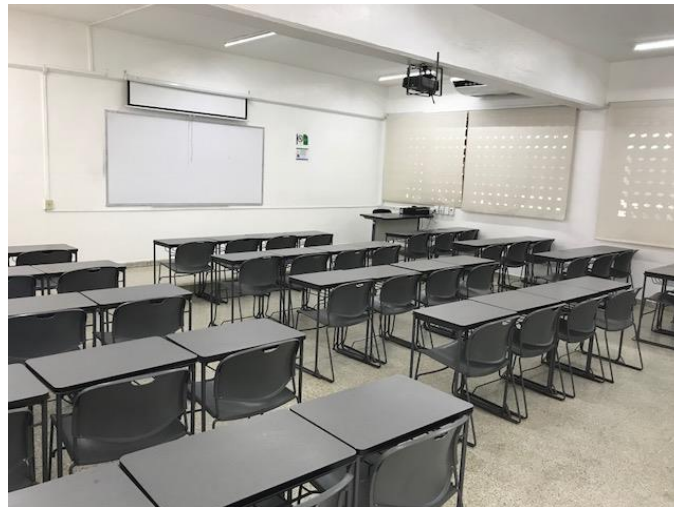
Imagen 11. Sala E

Sala E: ubicada en el tercer piso del edificio A, esta sala puede albergar hasta 40 estudiantes en mesas de trabajo individual; cuenta con aire acondicionado, computadora, proyector, pizarrón y acceso a Internet de punto fijo e inalámbrico.