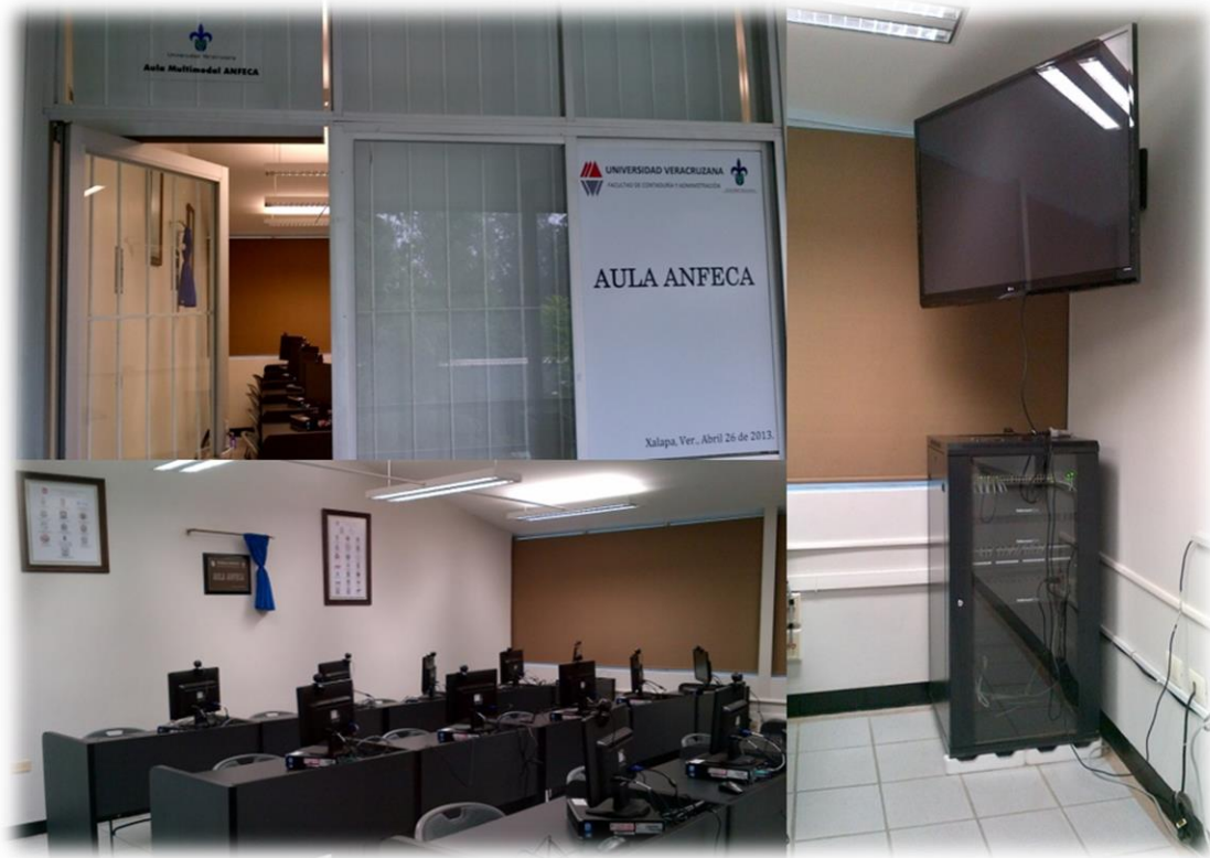
Imagen 7. Aula ANFECA