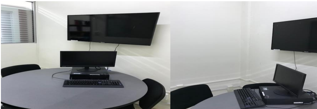
Imagen 19. Cubículos de trabajo

Asimismo, la Facultad cuenta con dos cubículos exclusivos para los profesores y alumnos de la Especialización, equipados con aire acondicionado, televisión de pantalla plana con acceso a internet, computadora con acceso a internet de punto fijo y red inalámbrica. Estos espacios permiten el desarrollo de asesorías y reuniones de trabajo en equipo.