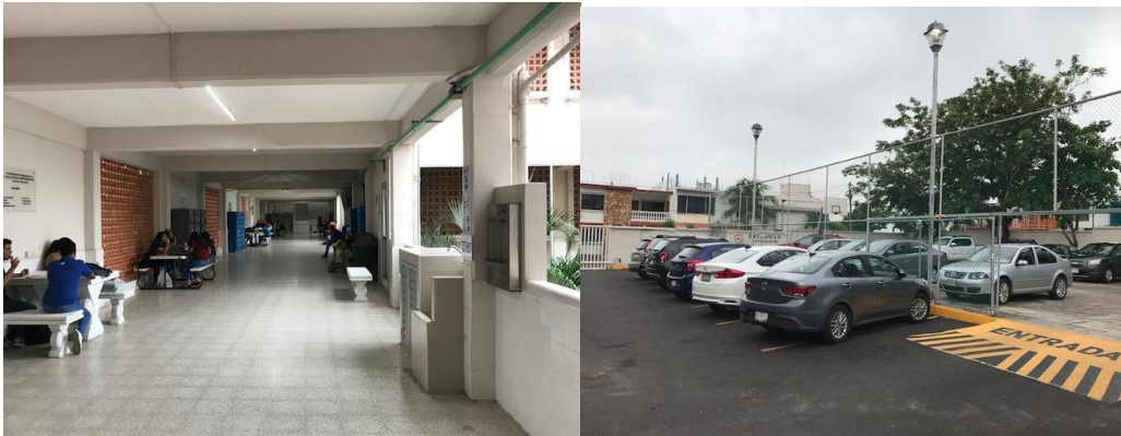
Imagen 10. Espacios de la subsede Veracruz