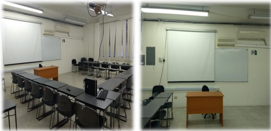
Imagen 6. Salón de clases de la EACE

En dicha área, el programa de posgrado de la Especialidad dispone de un aula totalmente equipada con pintarrón, video proyector, un proyector Optoma, una PC HP, un escritorio, una silla ergonómica, 32 mesas, 32 sillas, 2 ventiladores y 2 aires acondicionados COMFORT STAR-FREYVEN; internet alámbrico e inalámbrico para realizar investigaciones o simulaciones de negocios (imagen 6).