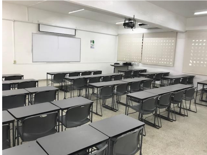
Imagen 12. Sala E