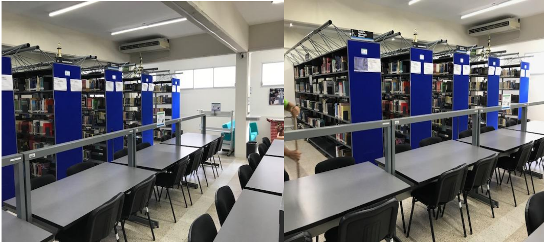
Imagen 18. Biblioteca y acervo

En esta biblioteca se cuenta con material bibliográfico especializado en comercio exterior, negocios internacionales y disciplinas afines. Además, el acceso a la red inalámbrica permite utilizar las bases de datos electrónicas a las cuales está suscrita la Universidad Veracruzana, lo cual amplía la gama de recursos para los profesores y estudiantes de la Especialización.