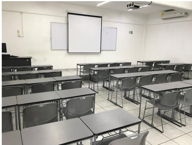
Imagen 14. Sala A

Sala A: ubicada en el primer piso del edificio C, ésta cuenta con la mayor capacidad ya que puede albergar hasta 48 estudiantes en mesas de trabajo individual; cuenta con dos aires acondicionados, computadora, proyector, pizarrón y acceso a Internet de punto fijo e inalámbrico.