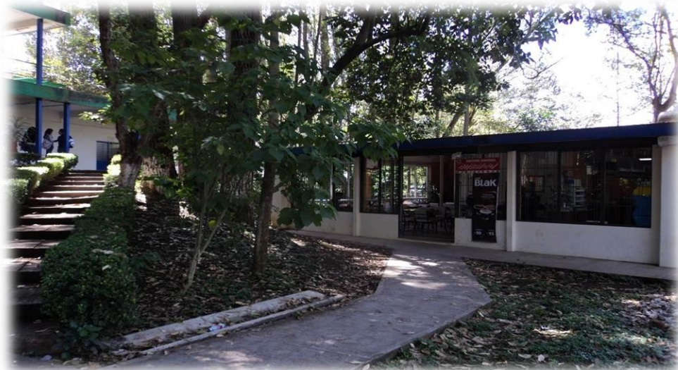
Imagen 4. Cafetería

Se dispone de una cafetería y una área de fotocopiado para la reproducción de materiales didácticos, exámenes, prácticas, entre otras (imagen 4).