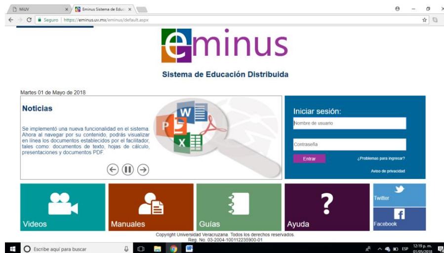
Imagen 20. Plataforma Eminus

Es importante destacar que tanto los profesores de tiempo completo como los de tiempo parcial poseen una cuenta institucional la cual les permite acceder a los recursos electrónicos de la Universidad Veracruzana, entre los que destacan el correo electrónico institucional, el Sistema Institucional de Tutorías y la plataforma Eminus, la cual, tal como se describe en el sitio de la Universidad, es un Sistema de administración de ambientes flexibles de aprendizaje, que permite presentar y distribuir contenidos educativos, brindando la posibilidad de contar con un “Campus digital” para la comunicación y colaboración sin límite de tiempo y distancia. Sin duda, este sistema contribuye al desarrollo de un espacio de aprendizaje flexible y al fortalecimiento de competencias asociadas directamente al uso de las tecnologías de la información y de la comunicación.