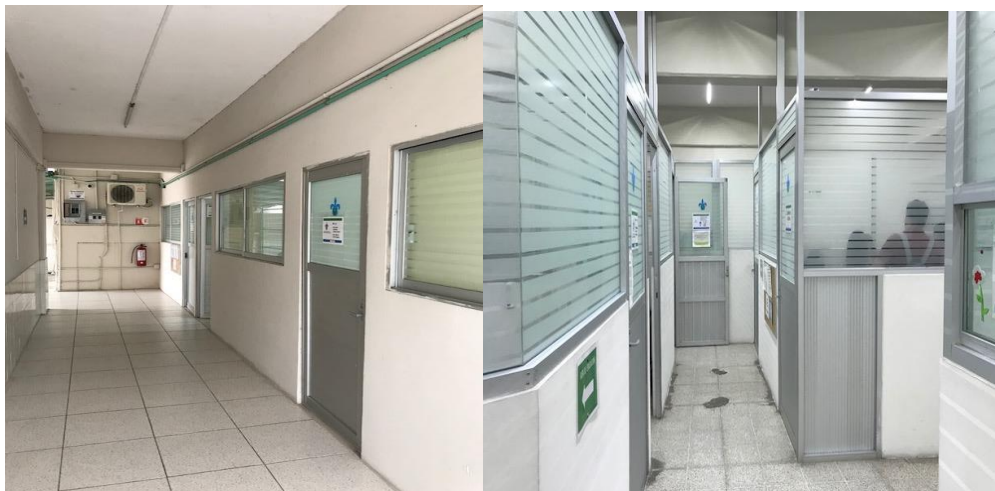
Imagen 11. Espacios para profesores de tiempo completo

Es importante destacar que los profesores de tiempo completo adscritos al Núcleo Académico Básico de la Especialización en Administración del Comercio Exterior cuentan con cubículos de trabajo equipados con aire acondicionado, computadora con acceso a internet de punto fijo y red inalámbrica. En éstos, los profesores pueden desarrollar trabajos de investigación y brindar asesoría a los estudiantes del programa.