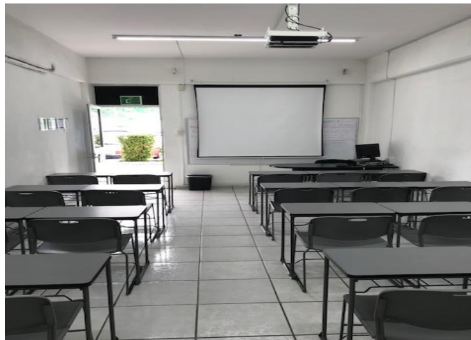
Imagen 13. Sala D

Sala D: ubicada en el primer piso del edificio C, ésta cuenta con capacidad para 25 estudiantes en mesas de trabajo individual; cuenta con aire acondicionado, computadora, proyector, pizarrón y acceso a Internet de punto fijo e inalámbrico.