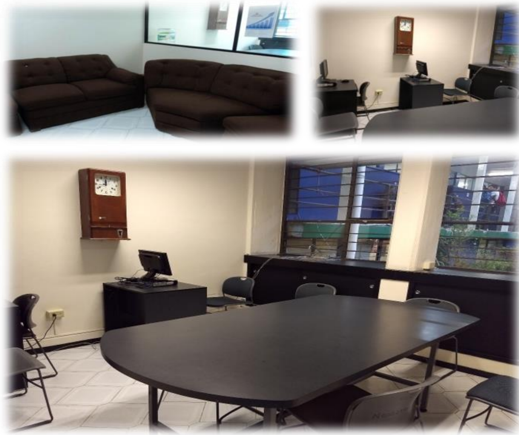
Imagen 8. Sala de maestros