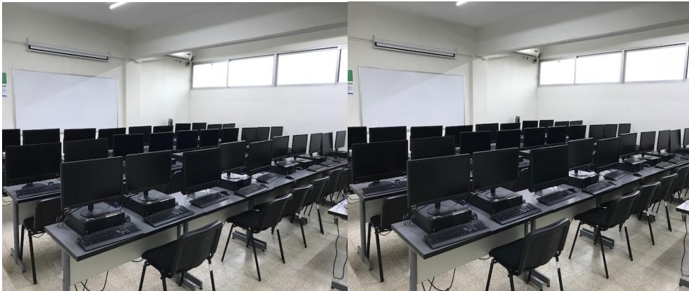
Imagen 16. Aulas de cómputo