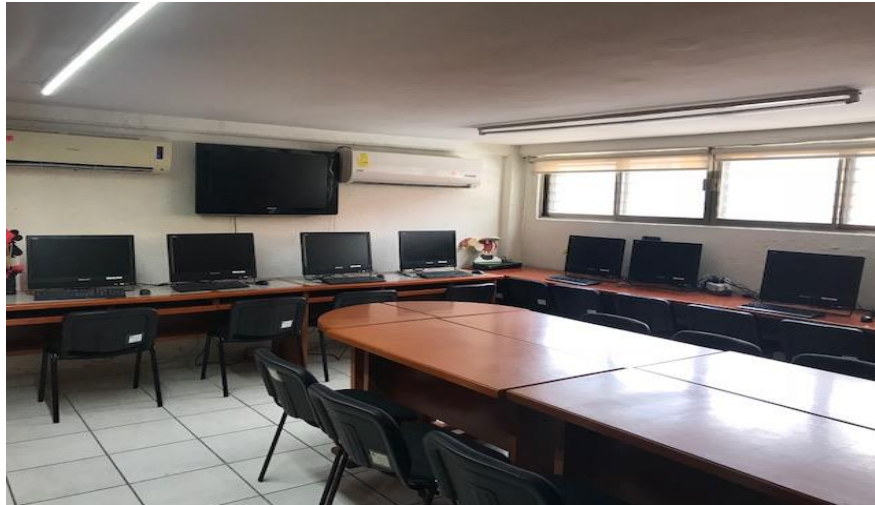
Imagen 12. Sala de maestros

En cuanto a los profesores de tiempo parcial, estos pueden utilizar las instalaciones de la sala de maestros, la cual cuenta con aire acondicionado, ocho computadoras con acceso a internet, red inalámbrica y mesas de trabajo. En este espacio es posible preparar el material de clase, desarrollar trabajos de investigación y brindar asesoría a los estudiantes del programa.