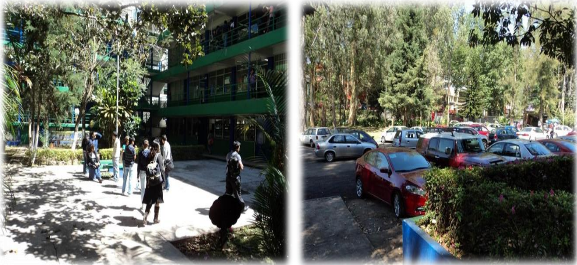
Imagen 3. Estacionamiento y Plaza cívica