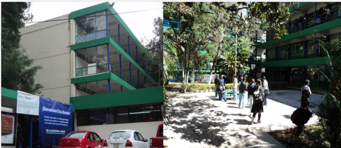
Imagen 1. Facultad de Contaduría y Administración

La sede en Xalapa, se oferta en la Facultad de Contaduría y Administración, campus Xalapa, la cual dispone de 5 edificios que contienen 40 aulas, servicios sanitarios en todos los edificios (imagen 1).