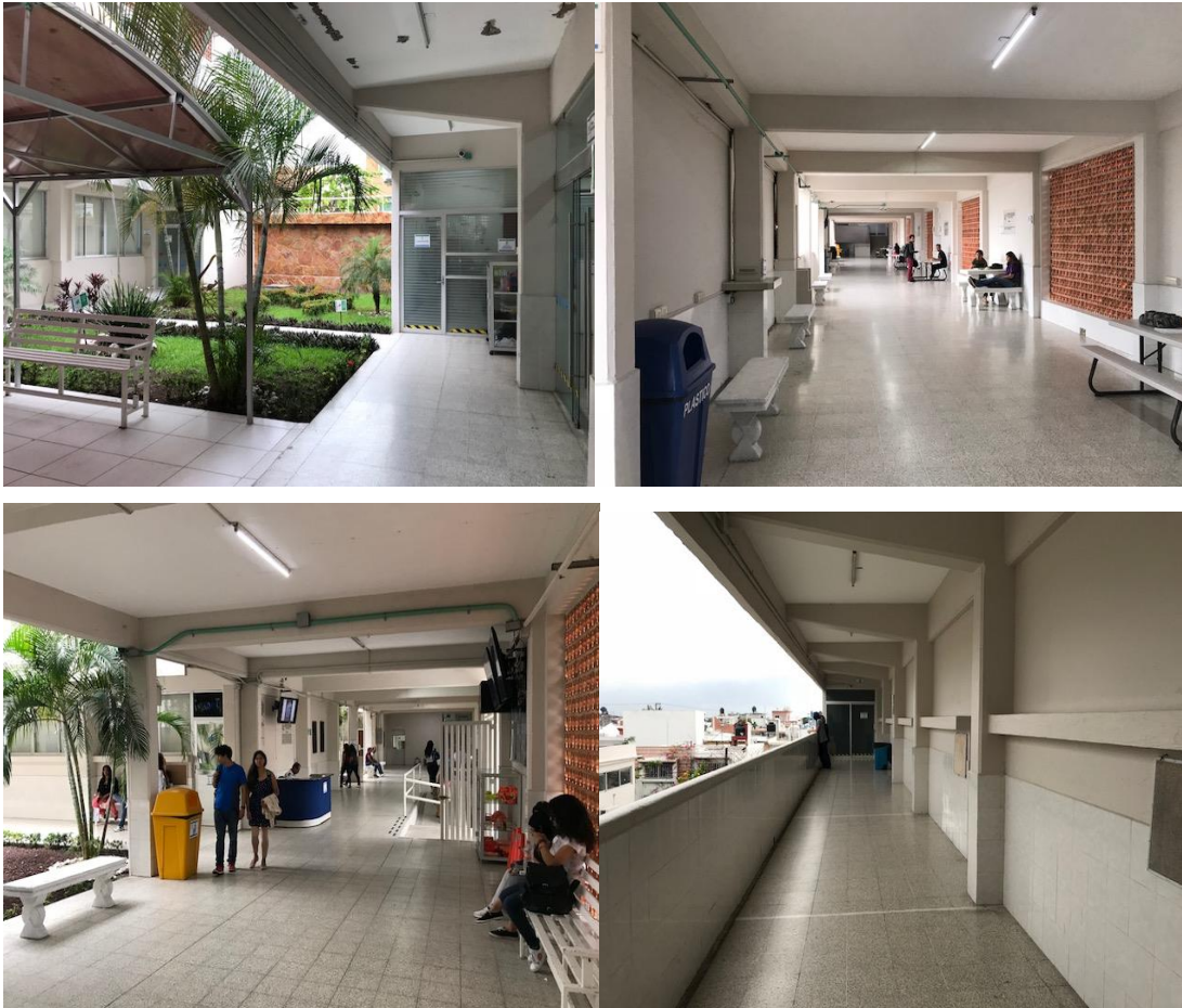
Imagen 9. Espacios de la subsede Veracruz

En cuanto a la Coordinación de Posgrado, esta se ubica en el Edificio C. Es importante mencionar que en todos los edificios está disponible el acceso a la red inalámbrica de la Universidad Veracruzana y es posible conectar los equipos de cómputo o los dispositivos móviles a fuentes de energía eléctrica. Además, se continúa con la construcción de un cuarto piso en el Edificio C, el más cercano al estacionamiento, con el fin de contar con una mayor cantidad de espacios para la oferta educativa.