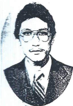
DELEGADO MAYOR 1977-1982

cumplió con los requisitos exigidos por los reglamentos correspondientes y fue aprobado en el examen profesional relativo, según acta de fecha diecinueve de abril de mil novecientos ochenta y cinco, levantada por el Jurado Especial de la Facultad de Medicina en Poza Rica, Ver., le expide el presente Título para ejercer la profesión de