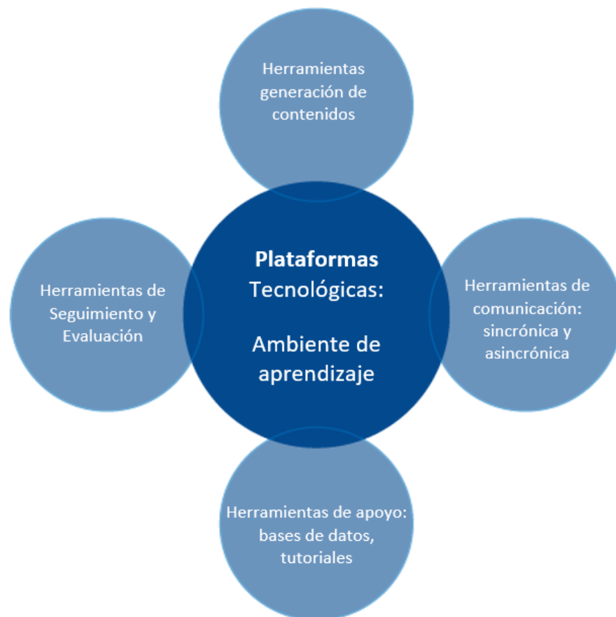
Ilustración 3 .- Herramientas de plataformas tecnológicas 6

Las herramientas de las plataformas educativas se muestran a continuación: