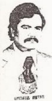
OFICIAL DEL DIBUJO

Dado en la ciudad de Xalapa de Enriquez, a los ocho días del mes de enero de mil novecientos noventa y uno.