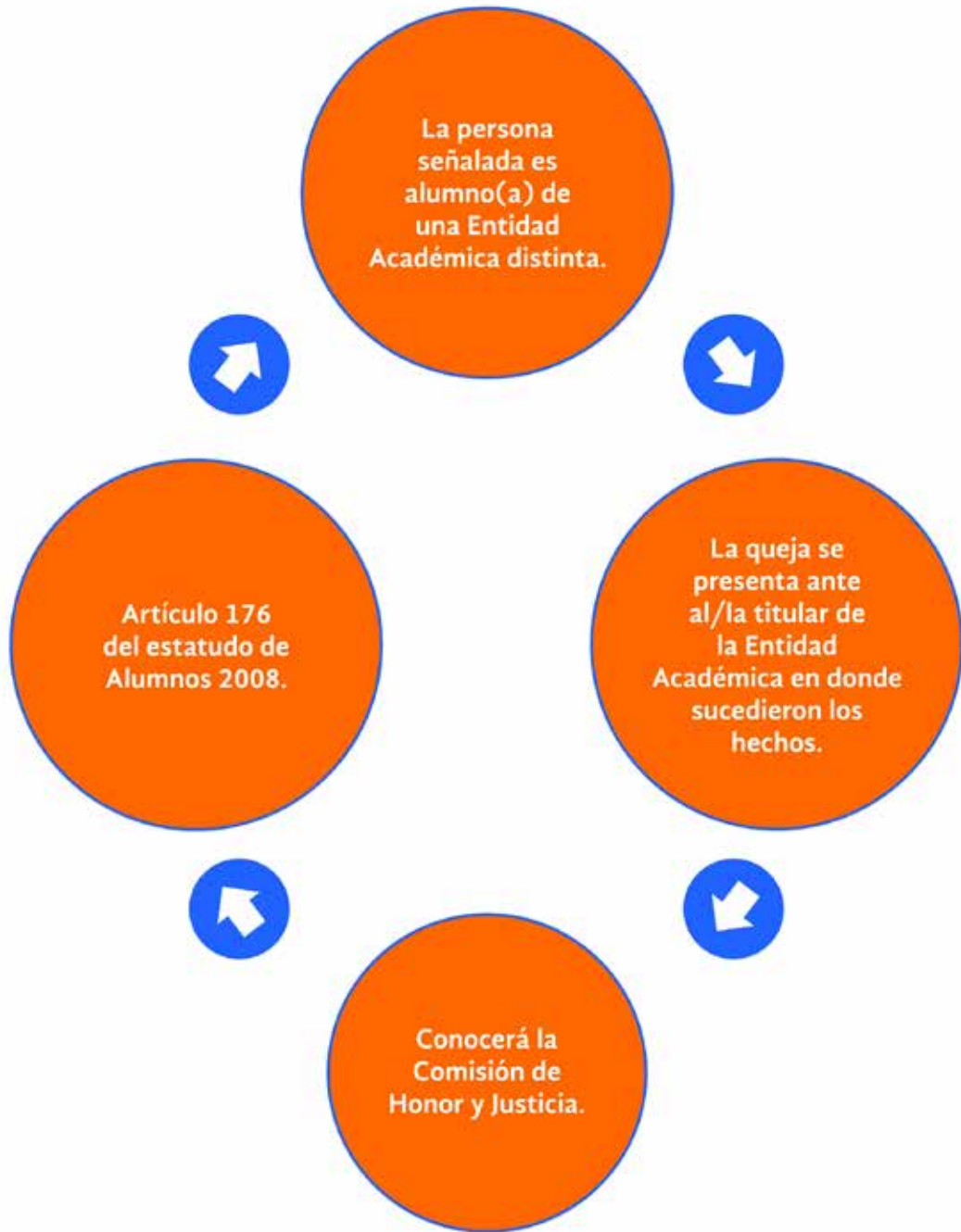
Anexo X.- Diagrama del procedimiento #2

Previo a que El/La Director(a) haga del conocimiento de El/La Rector(a) los hechos ocurridos, deberá signar un escrito firmado por la parte quejosa, con el objetivo de garantizar su derecho a decidir si iniciar o no un procedimiento.