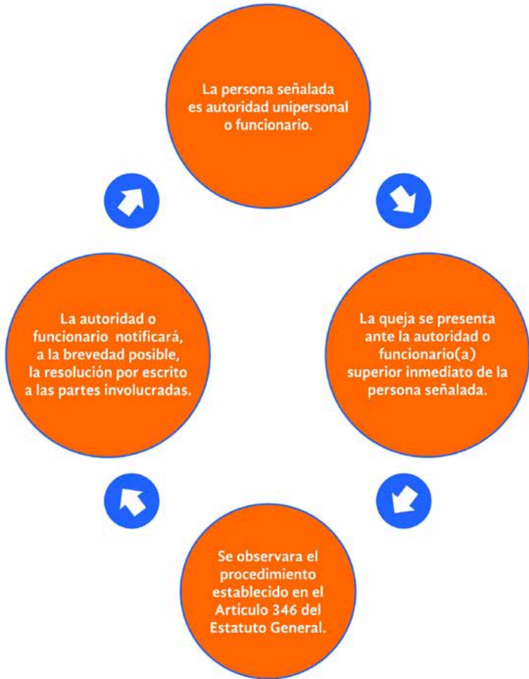
Anexo XII.- Diagrama del procedimiento #4

Si la persona fuera Director(a) y Secretario(a) de Facultad, Centro o Instituto, Director General o Secretario del Sistema de Enseñanza Abierta, se estará a lo estipulado en el procedimiento #5.