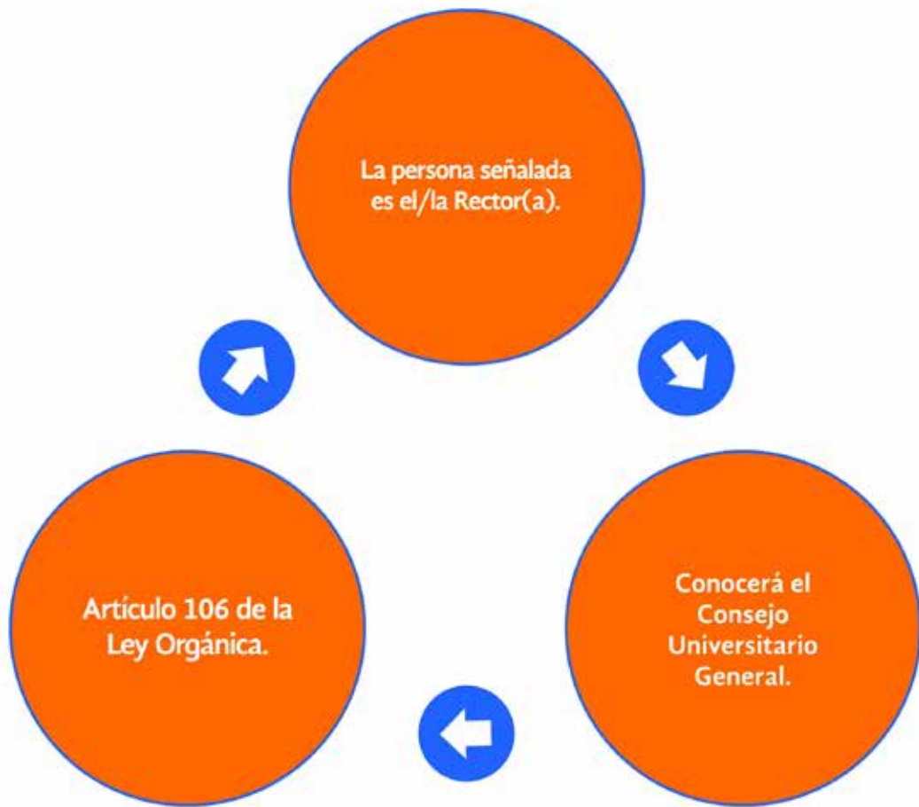
Anexo XVII- Diagrama del procedimiento #9

Todas las autoridades, funcionarios, tendrán como apoyo a las Coordinaciones Regionales de Equidad y a las(os) Representantes de equidad en sus entidades y dependencias, los cuales brindan orientación y apoyo para la incorporación de la perspectiva de género durante el inicio, seguimiento y valoración del caso en todo momento.