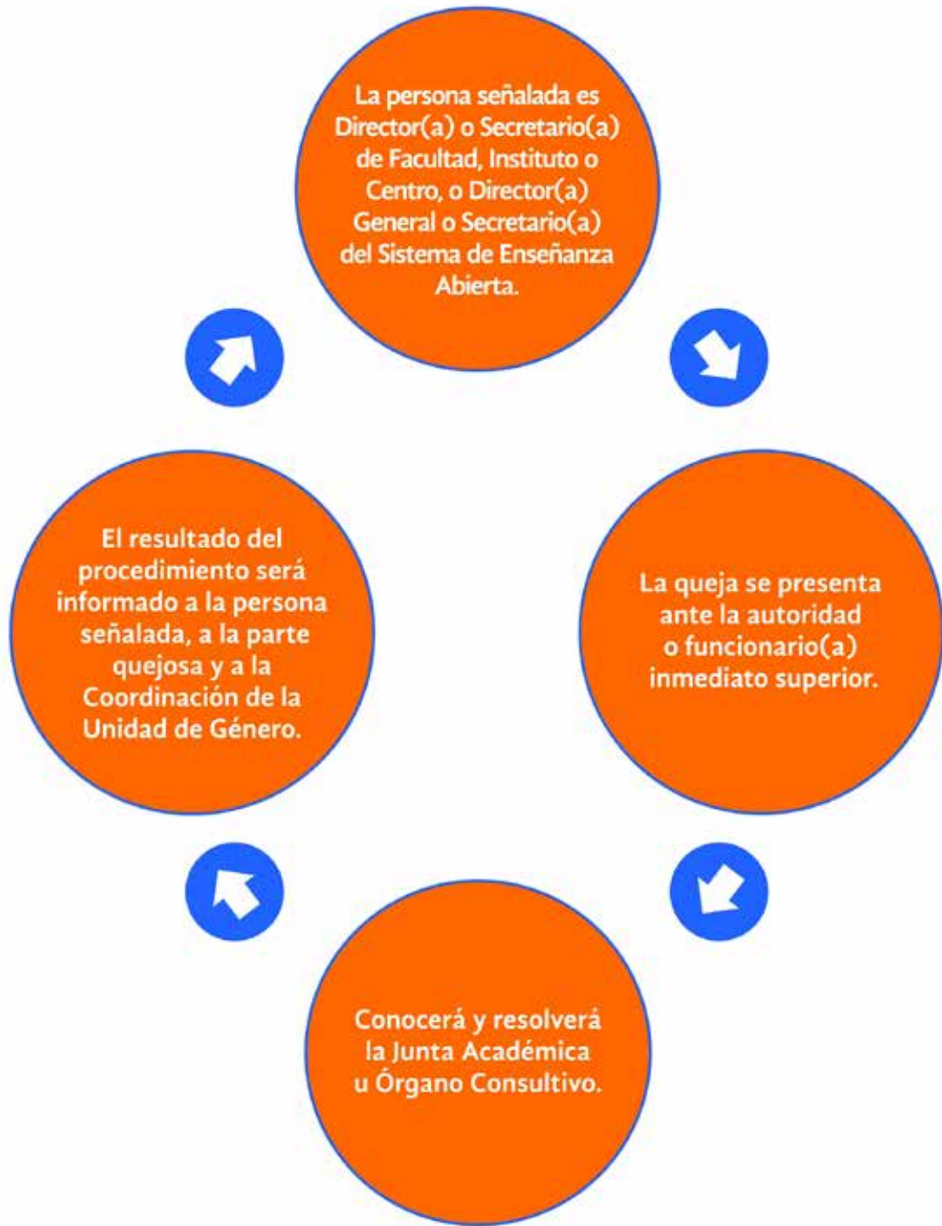
Anexo XIII.- Diagrama del procedimiento #5

Se deberá hacer del conocimiento de la Unidad de Género dicha diligencia y su seguimiento.