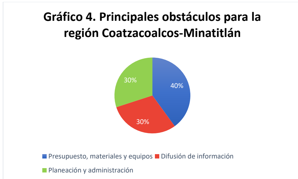
Gráfico 4. Principales obstáculos para la región Coatzacoalcos-Minatitlán

El análisis correspondiente a las principales necesidades identificadas para la implementación de los proyectos mantiene a la categoría de presupuesto para adquirir insumos u equipos de trabajo como prioridad en la región, ligeramente superior a la difusión de información y planeación y administración .