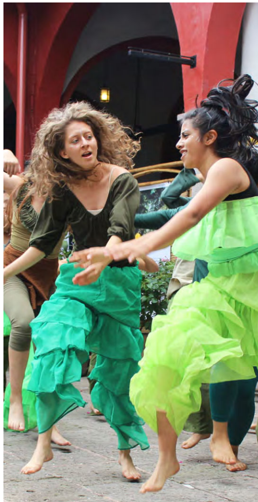
Performance: Humanity Facultad de Danza

ExpoSustenta plantea una posibilidad de conectar procesos, actores, necesidades, soluciones, experiencias, dudas, certezas e incertidumbres. Y con ello mantener la pregunta abierta sobre cómo podemos ser más equilibrados en los consumos y actuares de la vida diaria, cómo podemos cada día avanzar un poquito más en ser sustentables.