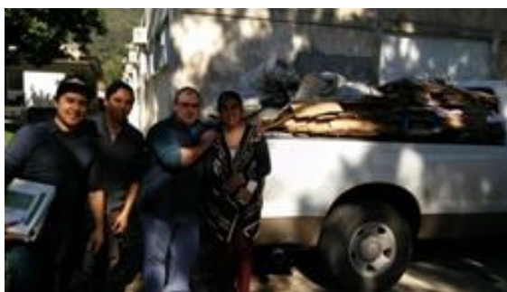
Orizaba - Córdoba