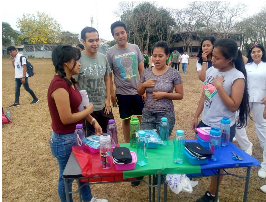
Entrega de premios al equipo ganador de la Carrera de obstáculos