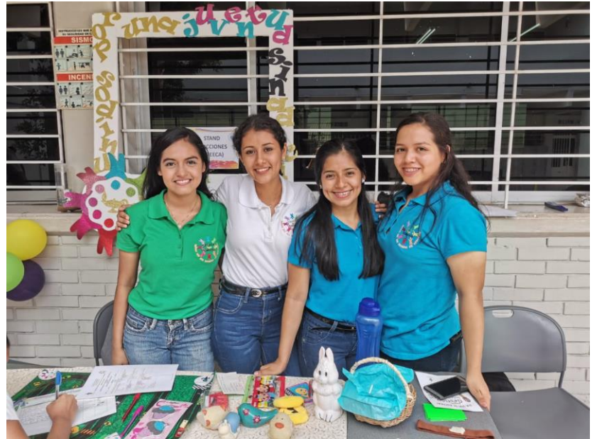
Integrantes del Grupo de Estudiantes de Enfermería Cintra las Adicciones (GREECA) liderando el Stand de adicciones