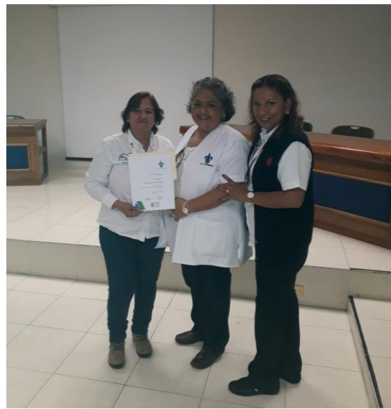
Entrega de constancia al personal del Centro de Salud Santa Clara.