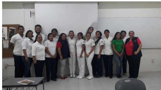
Alumnos y docentes asistiendo al taller "Habilidades para la vida" impartido por personal de Jurisdicción Sanitaria N° XI.