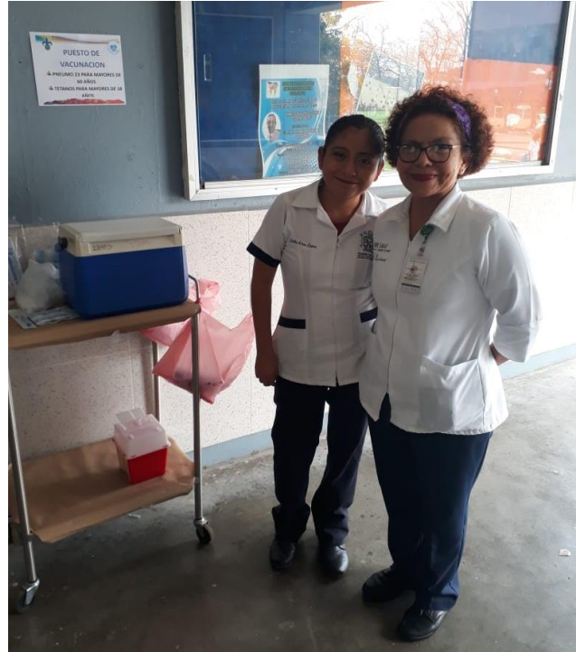
Aplicación de vacunas a los estudiantes del Campus Minatitlán, por parte del personal del Centro de Salud Urbano Santa Clara