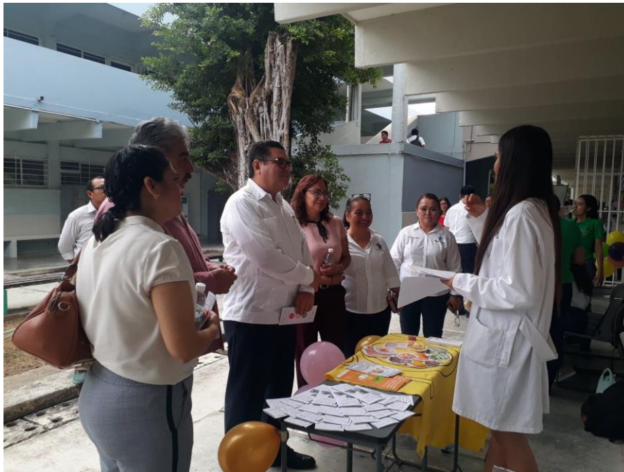
Módulo de Alimentación a cargo de personal de CSU Santa Clara