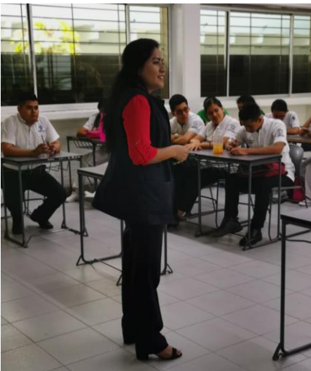
Personal de Jurisdicción Sanitaria N° XI

Se contó con la colaboración de Docentes y alumnos de la facultad de enfermería, personal de salud de la Jurisdicción Sanitaria N° XI, de los Centros de Salud Santa Clara y Jáltipan, así como de invitados especiales, para el desarrollo de las actividades programadas las cuales fueron Stands de atención a la salud, Módulos de información, puesto de vacunación, pruebas rápidas y actividades recreativas.