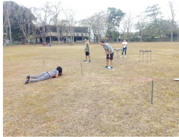
Carrera de obstáculos organizada para fomentar la actividad física en los estudiantes.