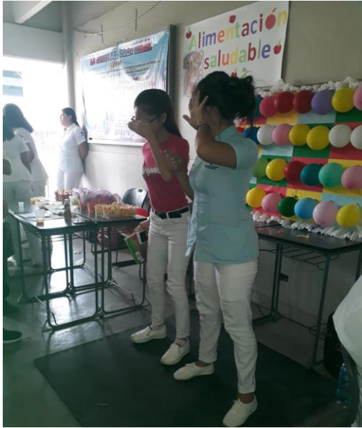
Stand de Alimentación saludable