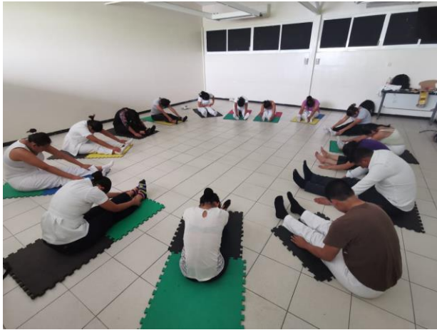
Módulo anti estrés dirigido por alumnos de la facultad de Enfermería