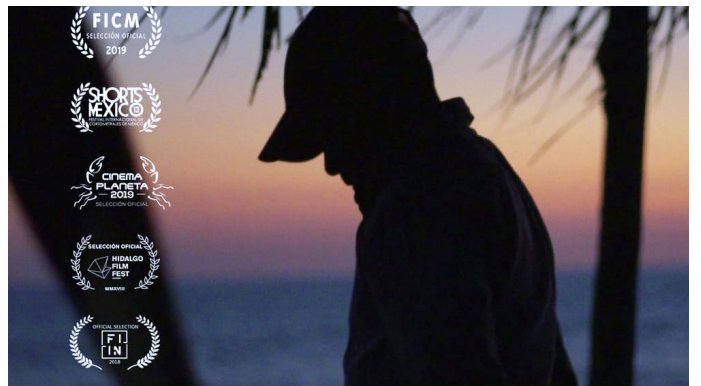
HASTA QUE NOS DURE LA MEMORIA

La comunidad de Coahuayula resguarda ecosistemas casi inexplorados por el ser humano, sin embargo, comienzan a sufrir embates de la deforestación, contaminación y caza furtiva; la comunidad no se quedará de brazos cruzados.