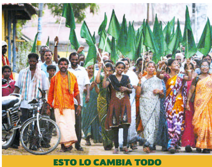
ESTO LO CAMBIA TODO

Este documental es una llamada de atención al ex presidente Obama y un grito de atención a todos los funcionarios de Estados Unidos, a fin de que consideren la creciente evidencia que demuestra que, dejar los combustibles fósiles en el suelo, es la única opción energética razonable para seguir adelante.