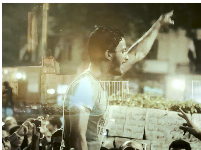
LA ERA DE LAS CONSECUENCIAS

Documental / Estados Unidos / 2016 / 80 min.