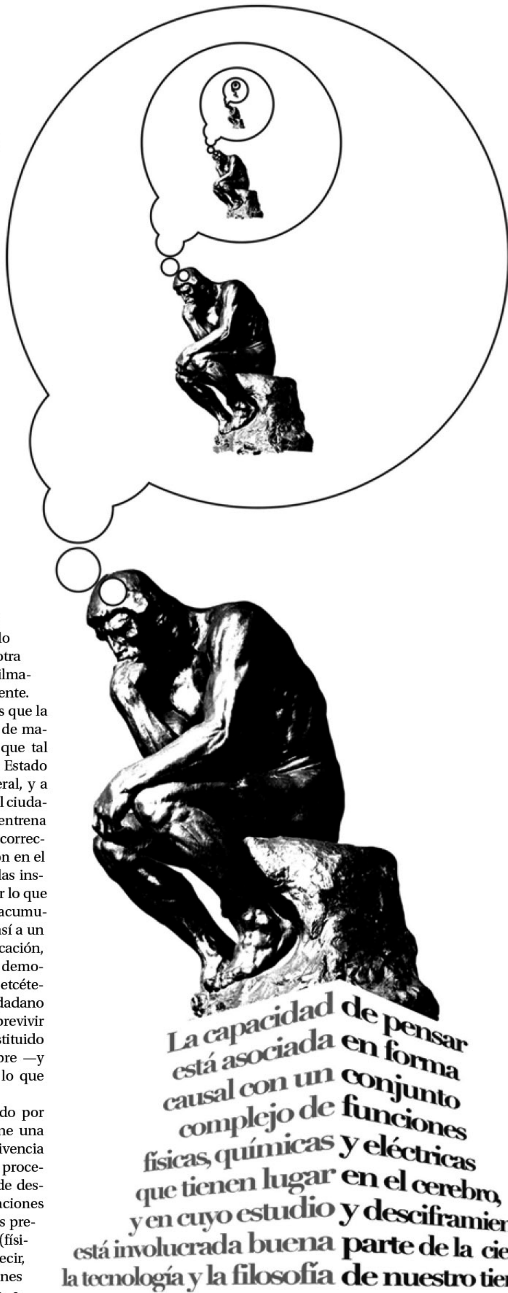
Ilustración: Sergio Segura

La capacidad de pensar está asociada en forma causal con un conjunto complejo de funciones físicas, químicas y eléctricas que tienen lugar en el cerebro, y en cuyo estudio y desciframiento está involucrada buena parte de la ciencia, la tecnología y la filosofía de nuestro tiempo.