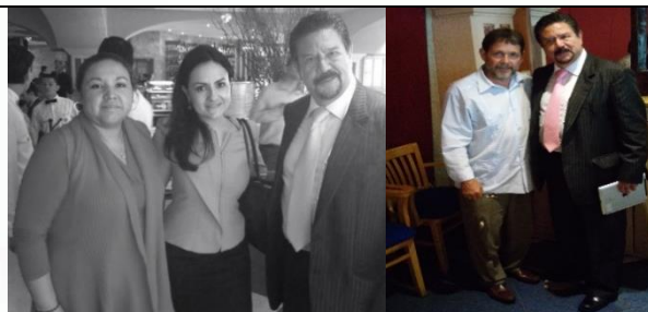
En la entrega de resultados