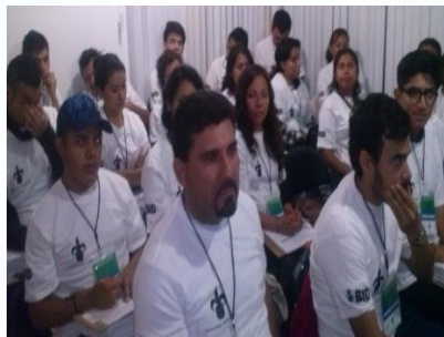
Equipo de trabajo de campo del CEOA, con el uniforme de trabajo.

En conjunto con el Banco Interamericano de Desarrollo (BID), en el diseño, planeación y organización de una encuesta, que permitió conocer la opinión ciudadana, jerarquización y comparación relativa que realizan los habitantes de la zona metropolitana Xalapa (Banderilla, Coatepec, Emiliano Zapata, Jilotepec, Rafael Lucio y Tlanehuayocan), entre las distintas temáticas; en el contexto de que la ciudad y su zona conurbada fueron elegidas para ser parte de la iniciativa ICES.