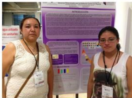
Durante la presentación de la sesión de carteles.