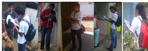
Durante el trabajo de Campo