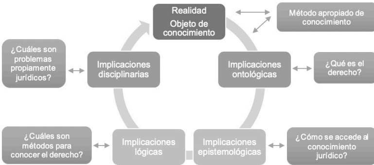
Figura 1 La realidad como objeto de conocimiento y sus implicaciones metodológicas en el campo del derecho.

Elaboración propia, con base en Rodríguez (2005).