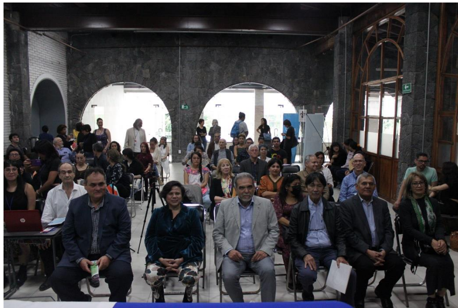
Foto oficial de la inauguración