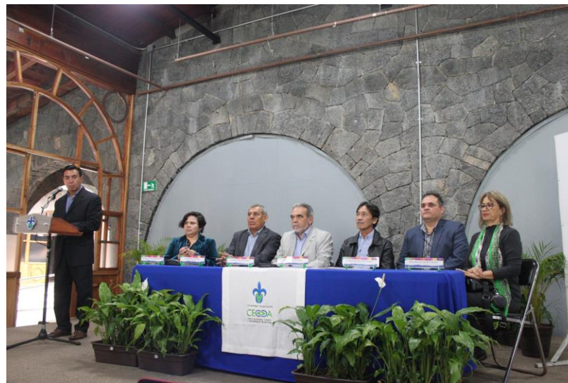
Presídium de la inauguración