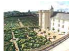
Château de Villandry