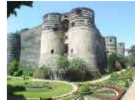
Château d' Angers