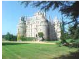
Château de Brissac