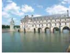
Château de Chenonceau