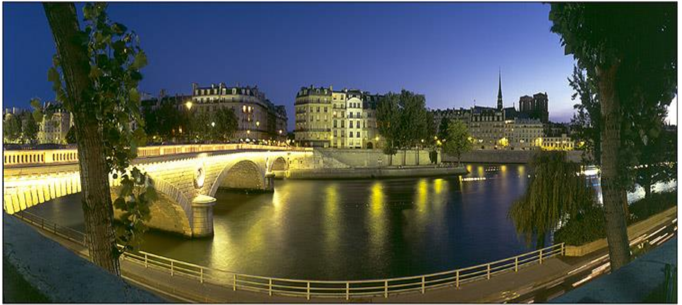
Le Pont Napoléon, l'Ile de la Cité et Notre-Dame de Paris , Paris, France

http://www.arnaudfrichphoto.com/photo-de-paris-pl1.htm