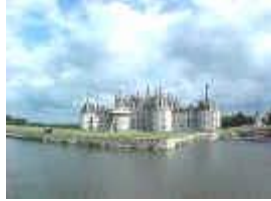
Château de Chambord