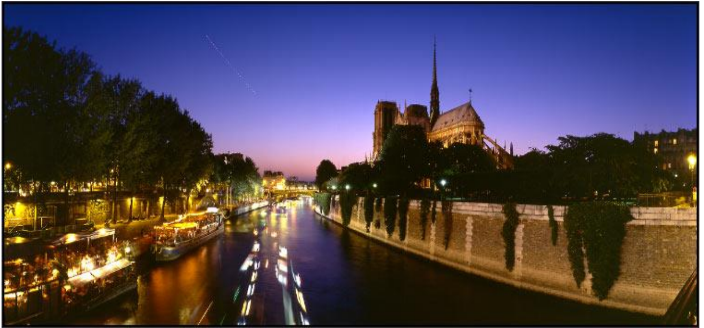
LA SEINE ET LA CATHEDRALE DE NOTRE-DAME , Paris, France El río sena y la catedral de Nôtre-Dame

http://www.arnaudfrichphoto.com/photo-de-paris-pl1.htm