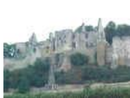
Château de Chinon