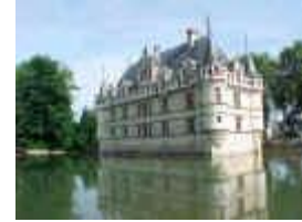
Château d'Azay le Rideau