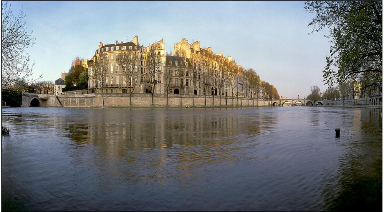
Quai de Bourbon , Paris, France

http://www.arnaudfrichphoto.com/photo-de-paris-pl1.htm