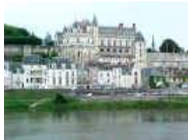
Château d' Amboise