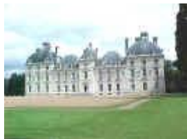
Château de Cheverny