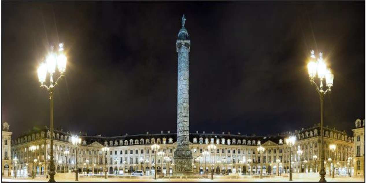
Place Vendôme , Paris, France