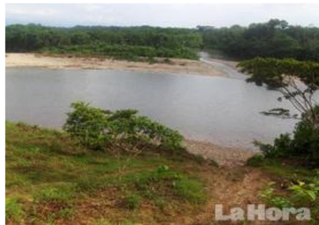
Frontera Norte: Tierra de nadie, miedo de todos