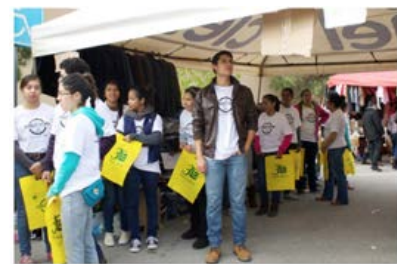
Figura 5. Street Store