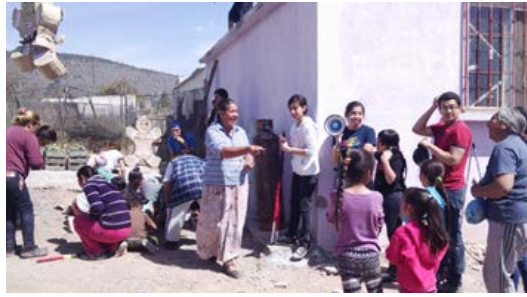
Figura 8. Ejido el Cedrito