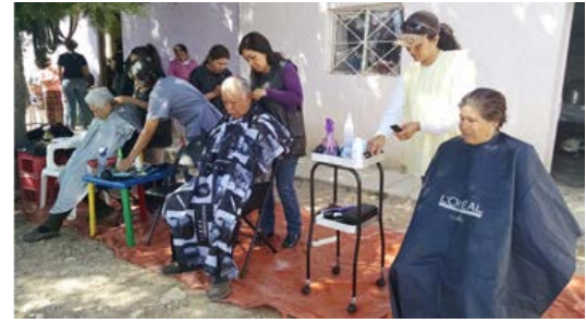
Figura 9. Ejido el Cedrito