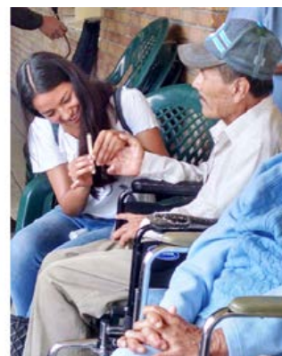
Figura 17. Asilo y ropero del pobre