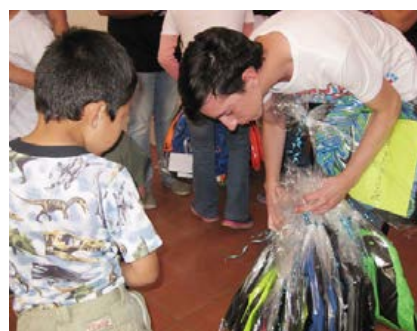
Figura 19. Asilo y ropero del pobre