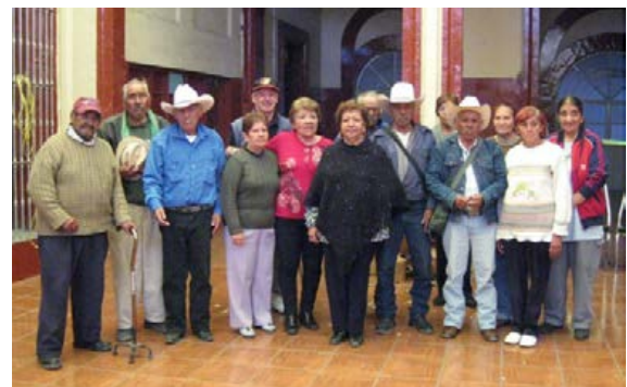
Figura 11. Asilo Buen Samaritano