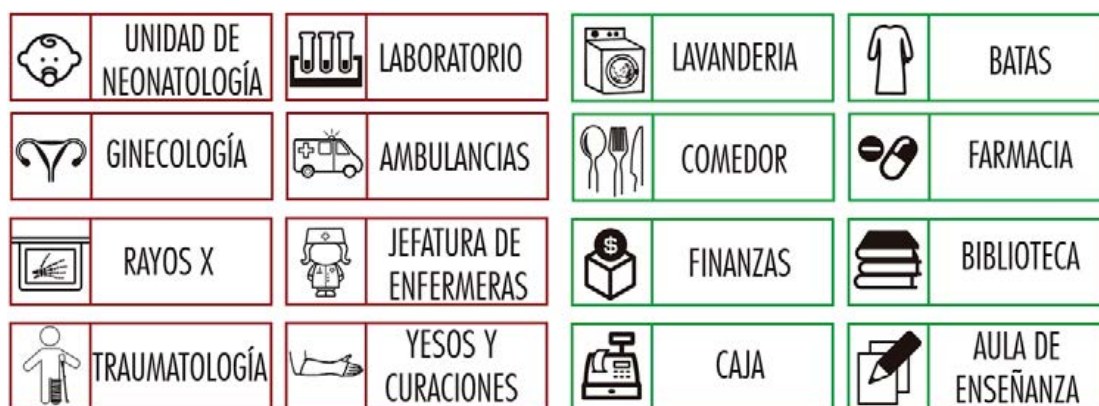
Figura 15. Señalética para el Hospital General en Saltillo, Coahuila.