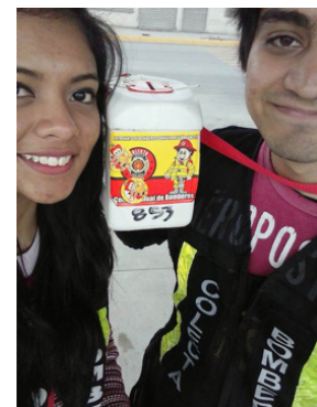
Figura 23. Colecta de bomberos