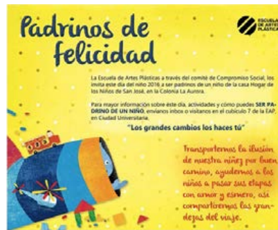
Figura 2. Banner Facebook "Padrinos"