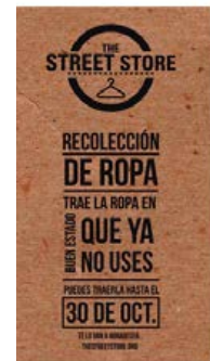
Figura 3. Banner Facebook STREET STORE