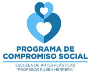
Figura 1. Identidad Programa Compromiso Social EAP. Autor: David Alva