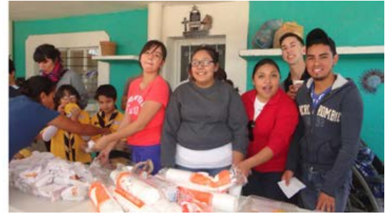
Figura 21. Ejido del Prado