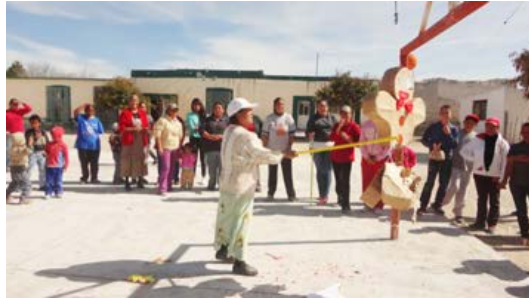
Figura 20. Ejido del Prado