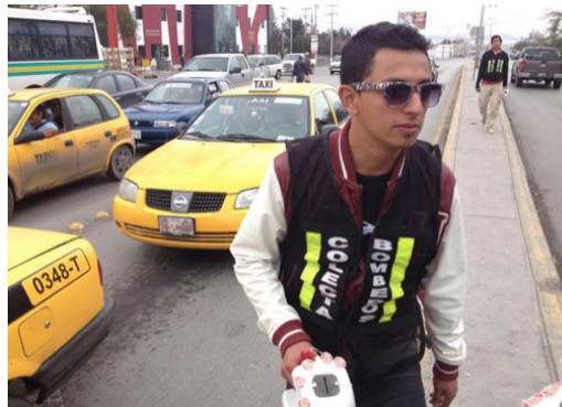
Figura 22. Colecta de bomberos

Se realizó servicio social en la campaña de recolección titulada “Ahora nosotros te llamamos a ti” en el mes de noviembre del año 2016. Los estudiantes se ubicaron en cruceros y plazas de la ciudad de Saltillo, Coahuila para realizar la colecta, que permitiría a los bomberos obtener recursos para el equipamiento en cuanto a trajes especiales, equipo y vehículos que permitieran llevar a acabo acciones de salvamento y apoyo a la comunidad en peligro por un incidente. Por los logros obtenidos en este servicio, los bomberos solicitaron que los estudiantes de la EAP participaran en todas las colectas. Además, refrendaron la invitación para realizar las prácticas profesionales en la producción de sus campañas de identidad gráfica y difusión (Figuras 22 y 23).