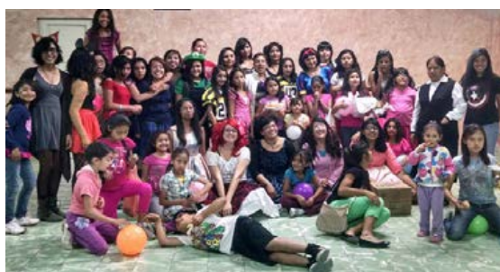
Figura 12. Convivencia en asilo

Según comentaron los estudiantes, organizar y ejecutar la actividad les permitió reconocer a la propia familia. La experiencia de convivir y conocer la vida de las niñas, les ofreció un testimonio de vida y esperanza que les hizo valorar su vida en familia. Además de la convivencia, se rediseñó la identidad de la institución y sus aplicaciones: rotulado de vehículos, lona exterior y página de Facebook (Figuras 13 y 14).