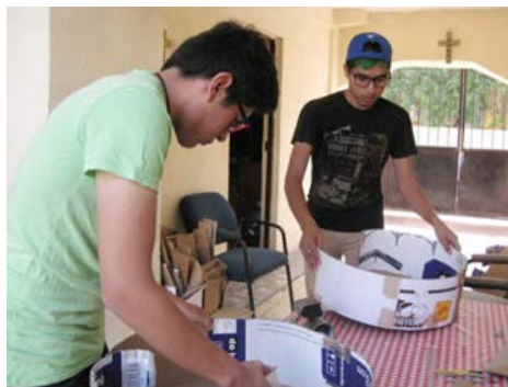
Figura 6. Elaboración de piñatas EAP

Durante todo el año del 2015 y a la par del resto de las actividades de servicio, se realizó la producción de piñatas, con el fin de donarlas a instituciones altruistas que ofrecen posadas a los grupos vulnerables y a escuelas que visitan los ejidos. En la actividad, se utilizó la piñata como símbolo de la cultura mexicana, como elemento de convivencia y unión entre las personas. Los estudiantes reportaron haber experimentado un sentimiento de entusiasmo al saber que las piñatas llevarían felicidad y fomentarían la unión entre las personas. El servicio social implicó diseñar piñatas con materiales donados (harina, periódico, rafia, papel de china, bolsa de harina y caja de cartón). Según los estudiantes, la actividad les hizo comprender la trascendencia del reuso. Con el sentido ecológico de este trabajo, los estudiantes desarrollaron la conciencia del doble uso de materiales (Figuras 6 y 7).