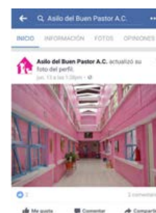
Figura 14. Perfil en Facebook