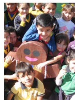
Figura 7. Elaboración de piñatas EAP