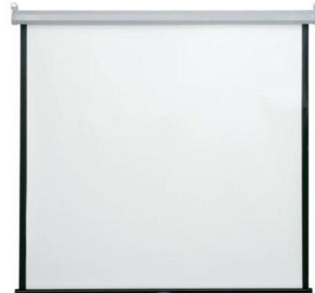
Pantalla de pared Aula 5 Aula 20 Aula 23 Aula 46 Aula 59 Aula 65