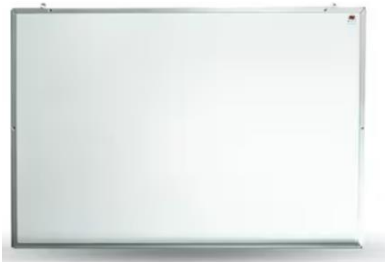
Mobiliario Aula 5 Aula 22 Aula 23 Aula 65