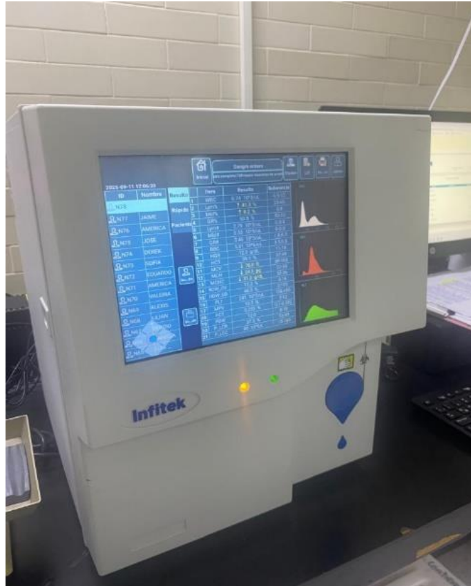
Analizador Lab. USASB