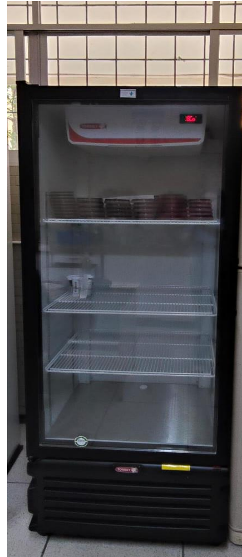
Refrigerador Lab I