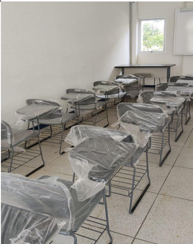
Mobiliario Aula 46