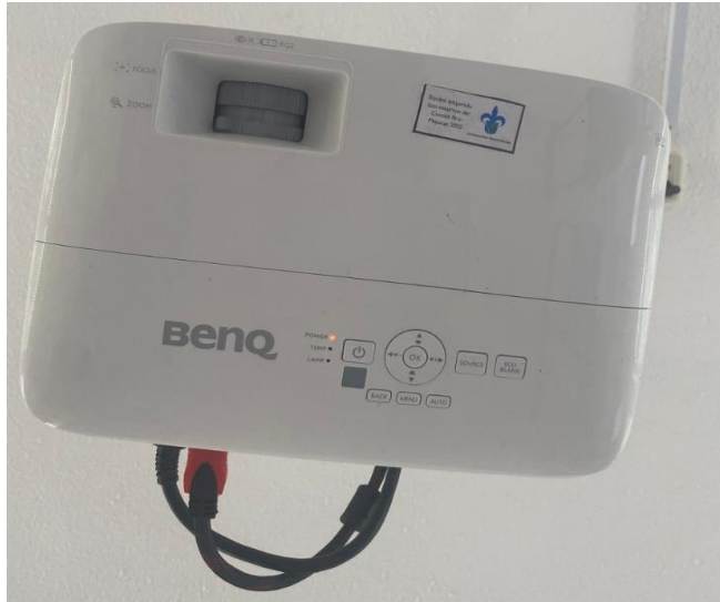
Video proyector Aula 20 Aula 59 Aula 65