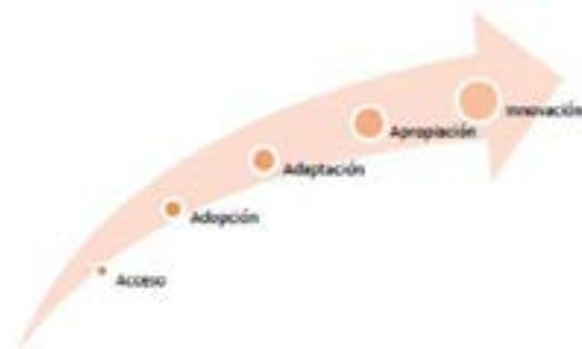
Figura 1. Etapas de desarrollo de la competencia digital

Además, el uso de las TIC contribuye a la mejora de la competencia digital del docente y del alumno, la cual se refiere a la habilidad de buscar, analizar, organizar y compartir información con la intención de transformarla en conocimiento. En relación con la adquisición de esta competencia, Jordi Adell 9 afirma que es un proceso evolutivo y que se alcanza a través de cinco etapas, como se muestra en la siguiente figura.