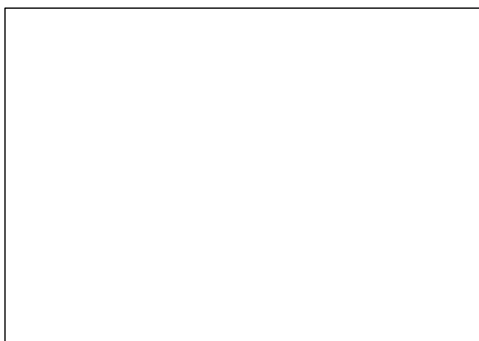
Figura 2. Formato vertical