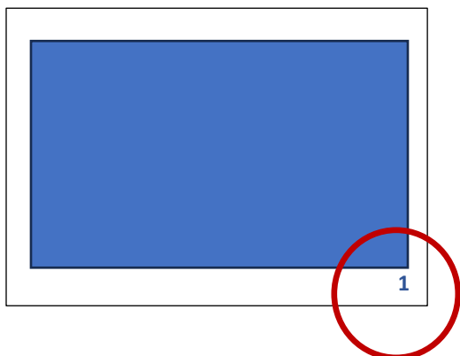
Figura 6. Numeración de las imágenes