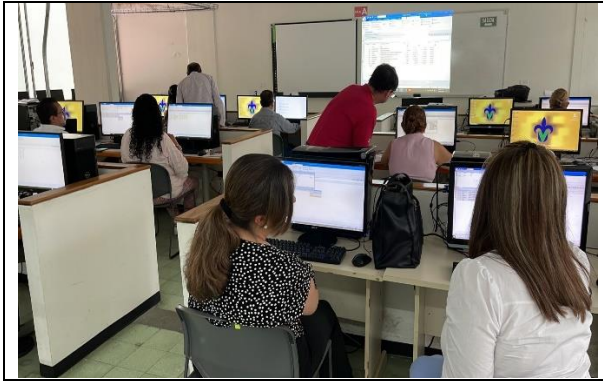
Curso "Operación del Sistema de Precios Unitarios Neodata", impartido a un grupo de 10 profesores del 5 al 13 de mayo de 2023.