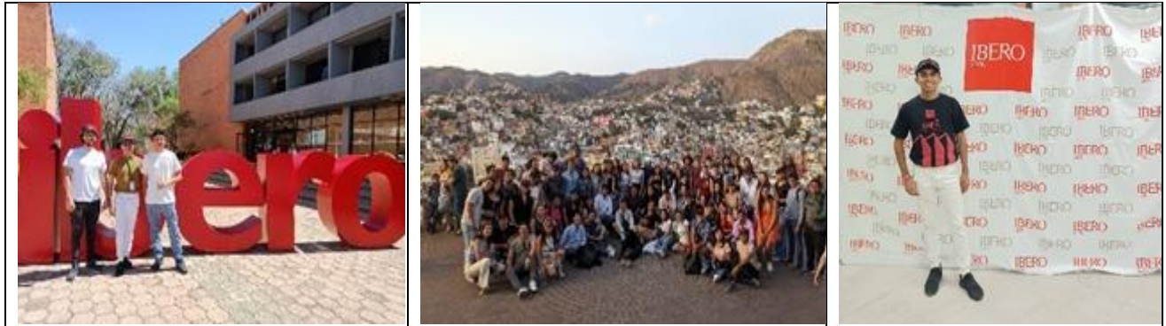
Participación de alumnos en el 34° Encuentro Nacional de Estudiantes de Arquitectura celebrado del 19 al 28 de abril de 2023.

Práctica de campo visita a la organización “Las Patronas” realizada el 10 de marzo de 2023 en Amatlán de los Reyes, Veracruz.