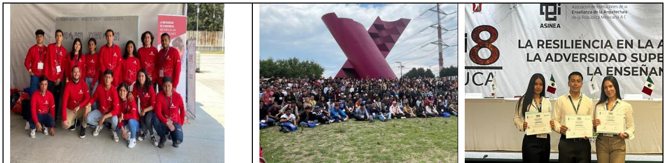
Alumnos participantes en la 108 Reunión Nacional de ASINEA celebrada en Toluca, Edo. De México del 17 al de mayo de 2023.