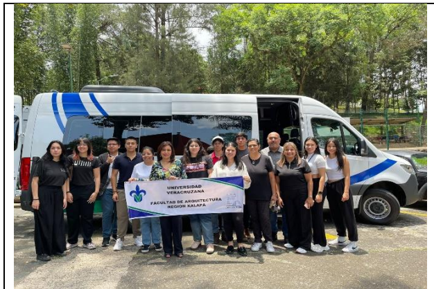
Renta de camioneta para alumnos y profesores que participaron En la 108 Reunión Nacional de ASINEA del 17 al 19 de mayo de 2023, Toluca Edo. De México