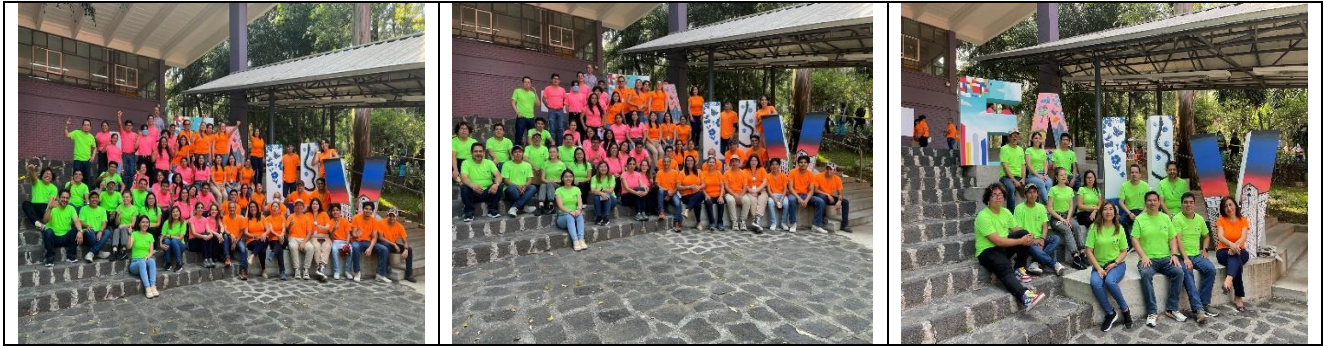
Playeras para Staff, integrado por alumnos y maestros que participaron en la aplicación del Examen Complementario EXANII, el día 21 de junio de 2023.