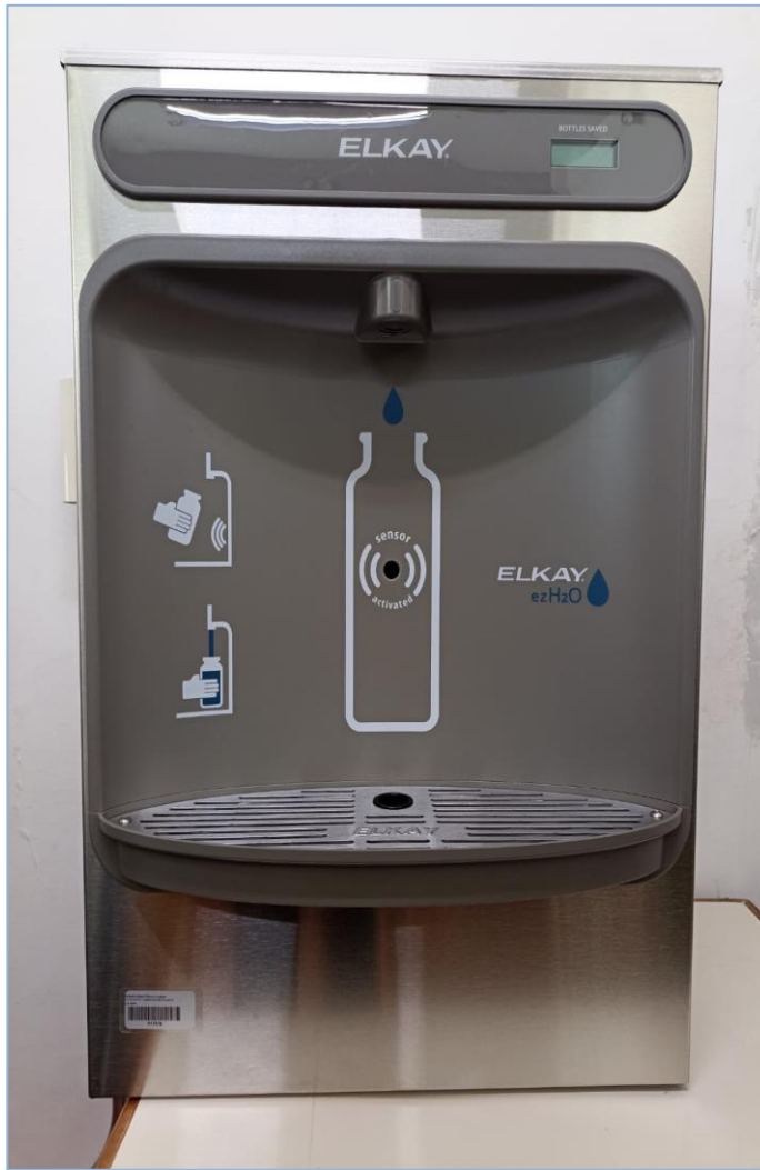
Estación de llenado de botellas de agua