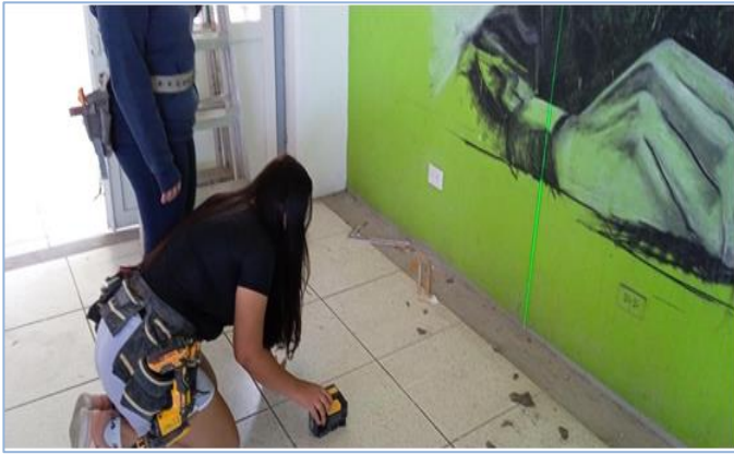
Participaron: 2 alumnos