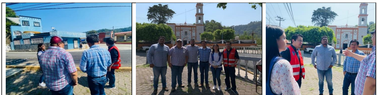
Participación de alumnos en práctica de campo titulada "Mejoramiento de imagen urbana", celebrada en Jilotepec, Ver. Del 8 al 29 de junio de 2023.