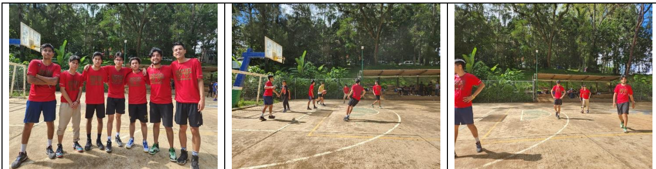
Playeras para integrantes del equipo de basquetbol representativo de la FAUV en el torneo Inter- Facultades.