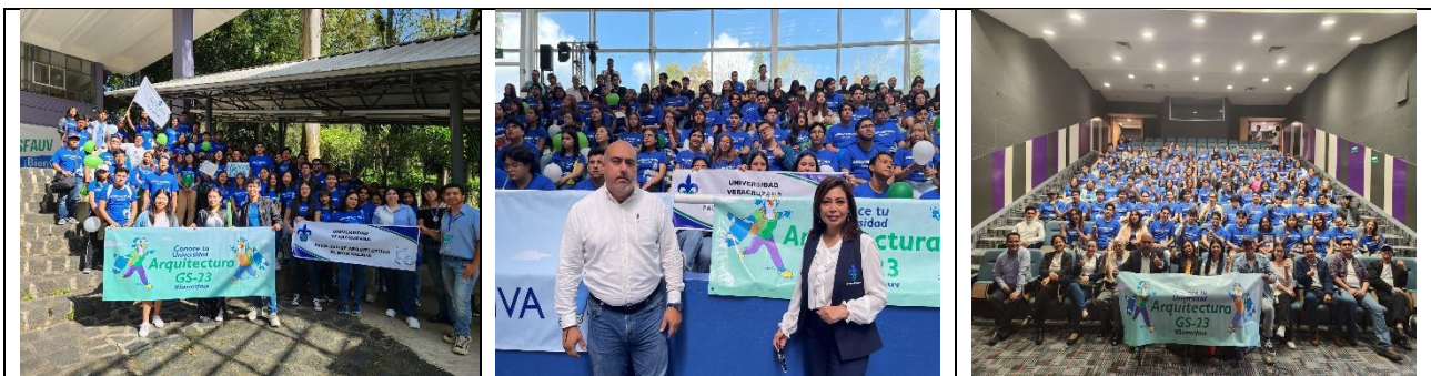
Playeras con cuello redondo para entregadas a los alumnos de la matrícula S23 (nuevo ingreso).