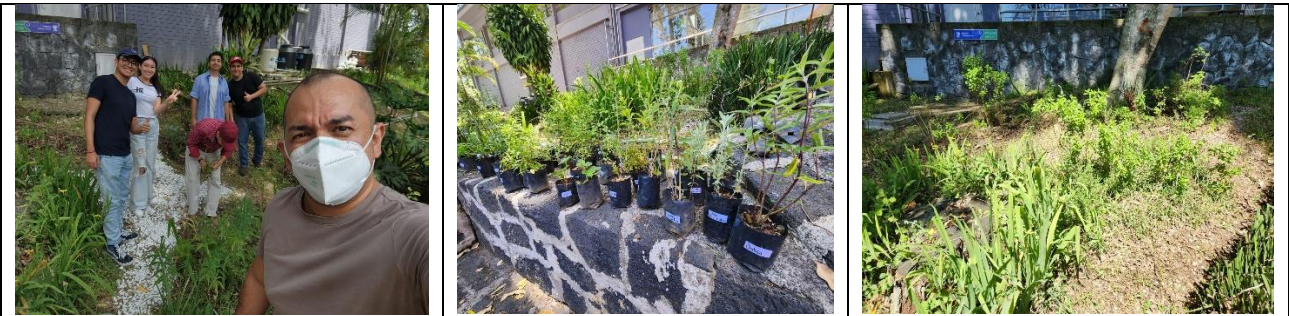
Práctica de campo titulada “Huerto FAUV” celebrada del 3 al 7 de julio de 2023 en el huerto de esta entidad académica.