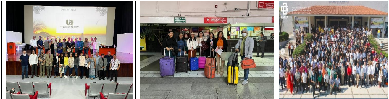
Alumnos y profesores participantes en la 109 Reunión Nacional de ASINEA celebrada en Puerto Vallarta, Jalisco del 8 al 10 de noviembre de 2023.