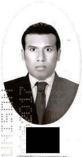
Firma del Interesado