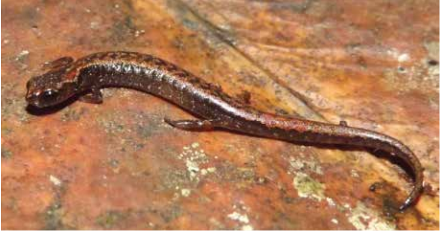
Figura 1 Adulto del tlaconete Thorius narismagnus Shannon y Werler, 1955 Los Tuxtlas Ver.

Equivalencia IUCN: Críticamente amenazada