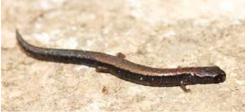
Figura 1 Adulto del tlaconete Thorius troglodytes Taylor, 1942.