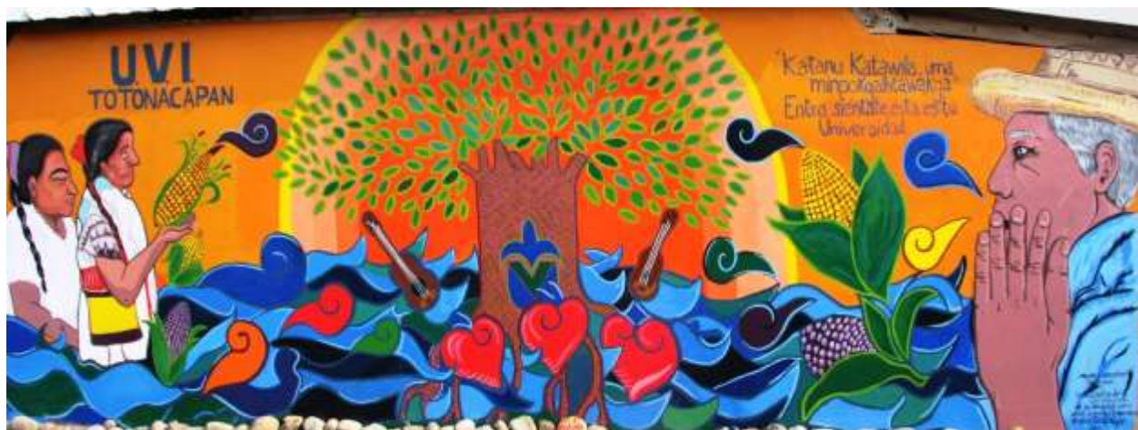
Mural Participativo, elaborado bajo la coordinación de la Asociación Tinta Negra, con estudiantes, niñas y adultos de Espinal, Veracruz.

Organización social, Experiencia educativa, Diálogo de saberes, Interculturalidad