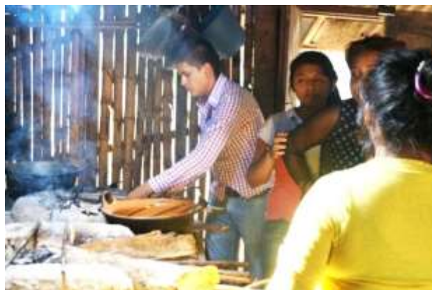
Fotos: Actividades de trabajo en el marco de la semana de vinculación comunitaria.

Al siguiente día, visitamos la cabecera municipal de Benito Juárez, el mercado de la cabecera municipal de Ixhuatlán de Madero. Durante este recorrido, los jóvenes tuvieron oportunidad de conocer el zacahuil huasteco y reconocerlo distinto al que se prepara en el Totonacapan.