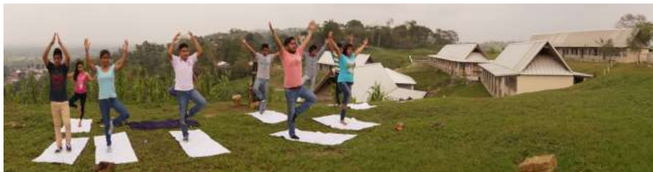
Foto: Estudiantes en el mirador de las instalaciones de la UVI Sede Regional Totonacapan. Espinal, Veracruz, Febrero 2016

Estos textos nos llevan a la reflexión de las organizaciones vista desde esquemas estructurados formalmente, sin embargo, también revisamos textos que permiten identificar algunas formas de organización comunitaria y que contrastan con esta mirada de organización formal.