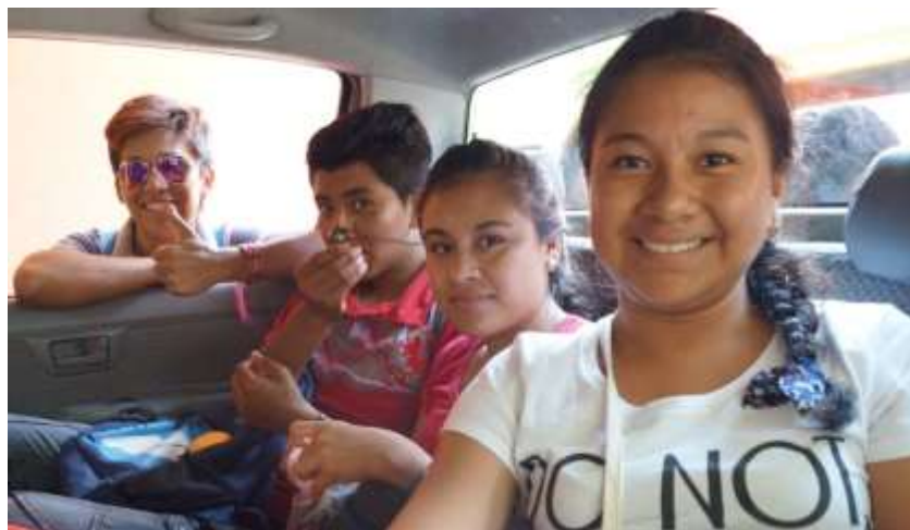
Foto: Estudiantes de la UVI Sede Regional Totonacapan, Mayo 2016

Respecto a los estudiantes que cursaron esta EE, lxs jóvenes universitarios de esta sección, son originarios de la región del Totonacapan, algunos de ellos herederos de la sabiduría local, con el Don de la danza, como dirían los abuelos de esta región; otros y otras más con el Don de la lengua totonaca. 17 estudiantes en total, de los cuales, 8 son hombres y 9 mujeres, entre 18 y 23 años de edad.