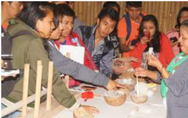
Visita a la Casa del Algodón