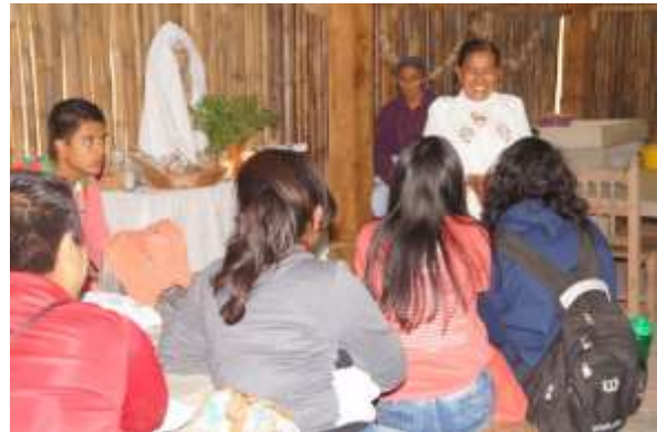
Visita a la Casa de la Alfarería

Es importante destacar que, esta visita fue articulada con dos proyectos de investigación y vinculación registrados en la Universidad Veracruzana, mismos que a continuación se mencionan: