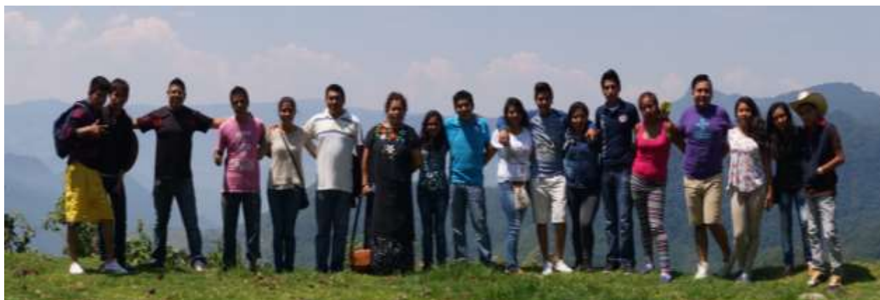
Foto: Estudiantes y docentes de la sección 201, Generación s15 de la Universidad Veracruzana Intercultural, Sede Regional Totonacapan, durante su visita a la Huasteca Alta. Huayacocotla, Ver. Mayo de 2016.

De la mano de esta caracterización del pedagógico se promueve una organización escolar que posibilite y genere la vinculación con las comunidades y/u organizaciones de la región, equilibrando el enfoque formativo e informativo en educación, estableciendo el aprendizaje de habilidades de comunicación y el autoaprendizaje en el hacer con el “otro” o con los “otros”.