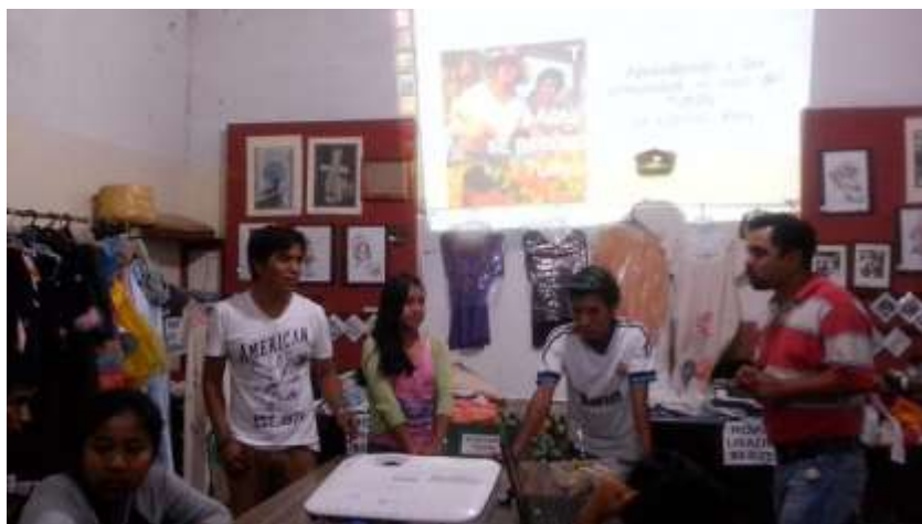
Foto: Visita a la Casa del TUMIN, Espinal, Ver. Marzo 2016