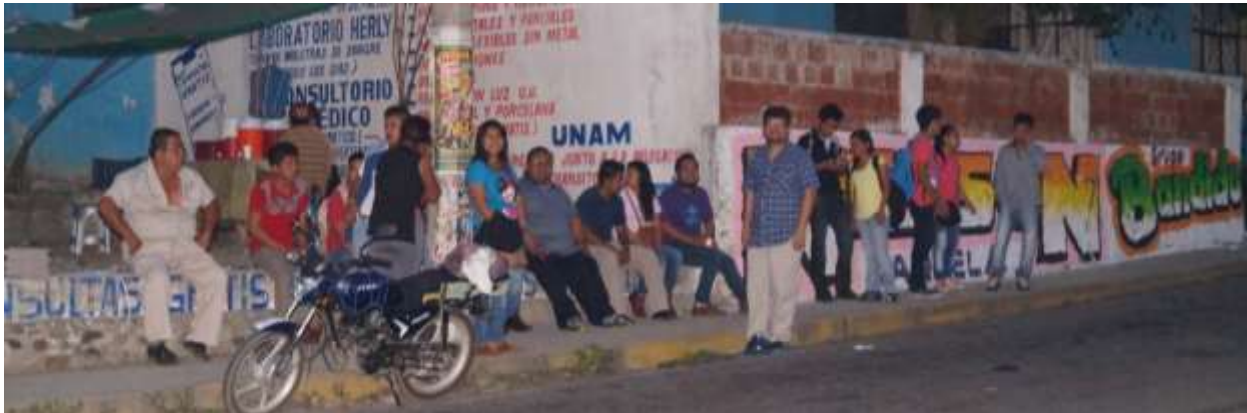
Foto: Estudiantes y docentes UVI, rumbo a Huehuetla. 18 de abril de 2016.

La segunda semana de vinculación comunitaria inicia con el amanecer del 18 de abril, en la parada de autobuses en Espinal. Dado que lxs jóvenes habían gestionado hospedaje solidario en el CESIK, acordamos pedir el vehículo institucional para poder llevar colchonetas y las maletas de todxs lxs estudiantes y profesorxs.