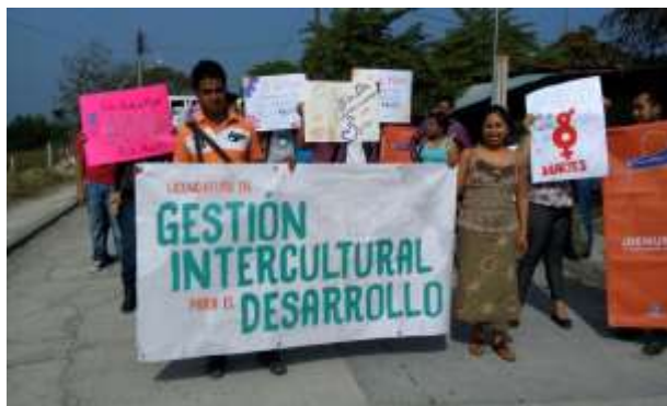
Fotos: Participación de lxs jóvenes de la UVI en la marcha del Día Internacional de la Mujer. Espinal, Ver. Marzo 2016.

En relación a las Mayordomías, los señores del pueblo consideraron que la charla debía tenerse en días posteriores, de tal forma que les diera tiempo de reunirse y poder charlar “bien” de la organización que tienen. Por lo que tampoco fue posible realizar dicho espacio de diálogo.