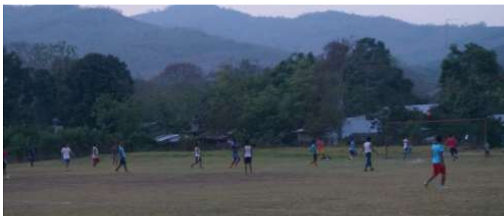
Foto: Fútbol en Puyecaco. 2016