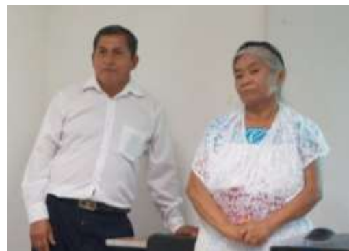
Foto: Medicos tradicionales del Hospital Comunitario