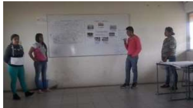
Fotos: Estudiantes del primer semestre, presentando sus diferentes mapas de organizaciones de Espinal, 2016.

Entre las reflexiones que destacan de este ejercicio, me permito registrar tres, que me parecen recuperan el sentido del trabajo realizado y las expectativas que de este primer ejercicio emanan: