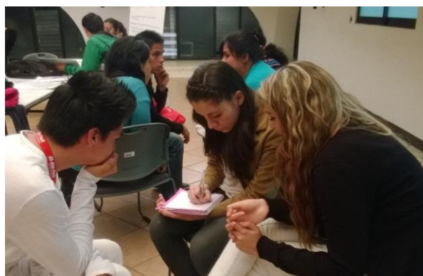
Ejercicio de coevaluación de productos de la primera unidad. Estudiantes de Diversidad Cultural 2014.