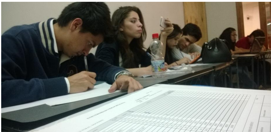
Lecturas compartidas, previas al debate en clase. Estudiantes de Diversidad cultural. 2014