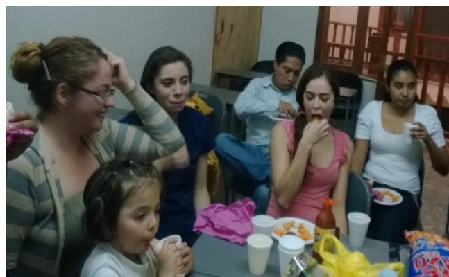
Convivio final. Estudiantes de diversidad cultural 2014.