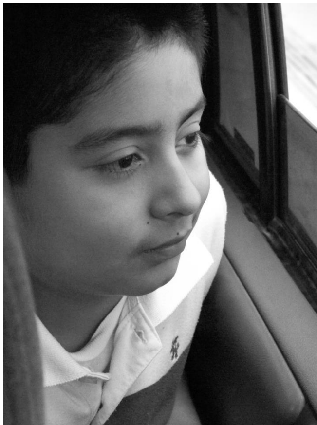
Rumbo a lugares desconocidos. Julio de 2012.

Trabajo desde hace 9 años en la Universidad Veracruzana Intercultural, en las sedes Huasteca, Totonacapan y actualmente en Xalapa, en lo que conocemos como Casa UVI.