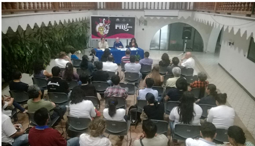
Participación de los estudiantes de diversidad cultural en la FILU2014.