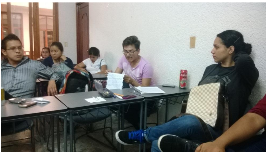
Lectura de bitácoras. Estudiantes de diversidad cultural 2014.

Otras de las actividades fue la elaboración de una bitácora que permitiera recuperar la experiencia de los estudiantes en este curso, de tal forma que sus opiniones retroalimenten los cursos posteriores. Es importante mencionar que una sesión de trabajo los estudiantes compartieron algunos de los apartados de las bitácoras que elaboraron.