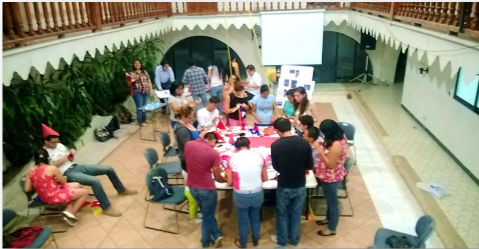
Festival de la diversidad cultural en el día del niño. Estudiantes de la EE Diversidad cultural.