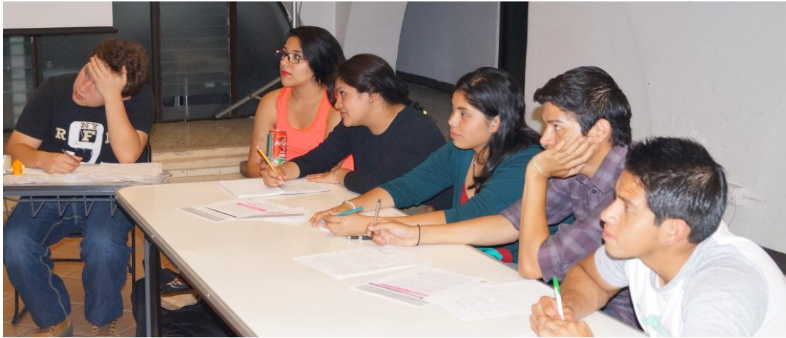
Mesa de propuesta de temas afines a las formaciones profesionales. Estudiantes de Diversidad cultural 2014

Posterior a esto, se trabajó en la lectura del programa y su propuesta de evaluación, los estudiantes trabajaron en una propuesta alterna que después fue negociada con al docente de la clase. De estos ejercicios surge el acuerdo de evaluación firmado por estudiantes y maestra, con el fin de clarificar las condiciones para el mejor desarrollo de las actividades en clase, los compromisos que se establecían en ambas partes, así como las formas de evaluación.