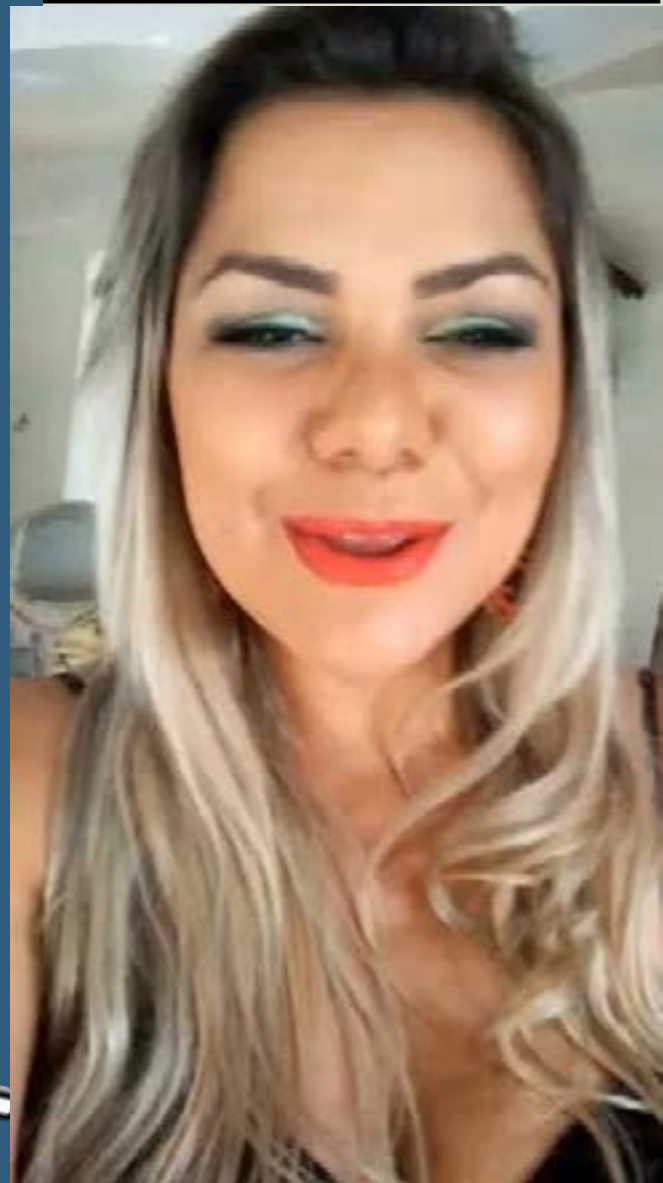
Video del Centro de Idiomas Xalapa