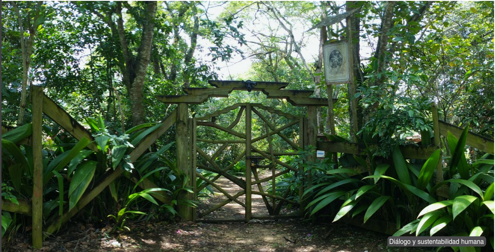
Diálogo y sustentabilidad humana