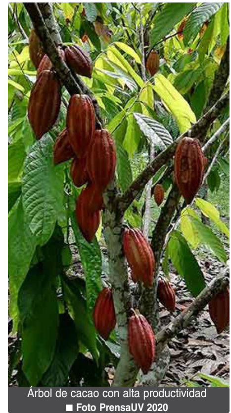
Árbol de cacao con alta productividad

*Integrantes del Cuerpo Académico UV-CA-263, Manejo y conservación de recursos bioculturales