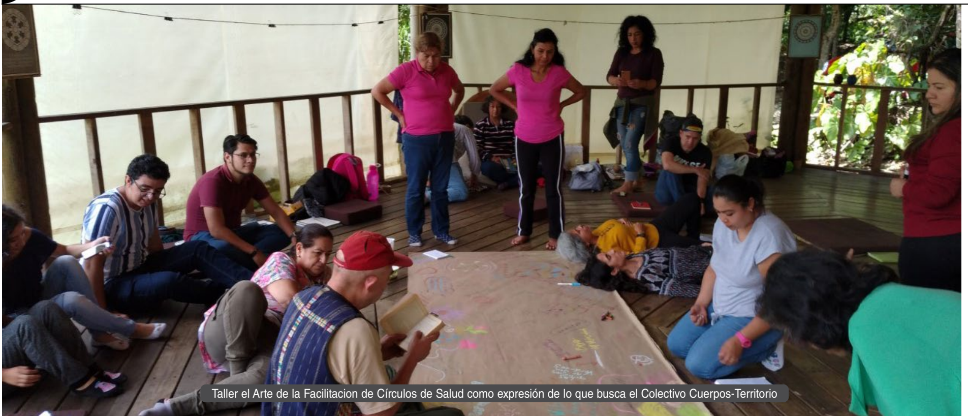
Taller el Arte de la Facilitación de Círculos de Salud como expresión de lo que busca el Colectivo Cuerpos-Territorio