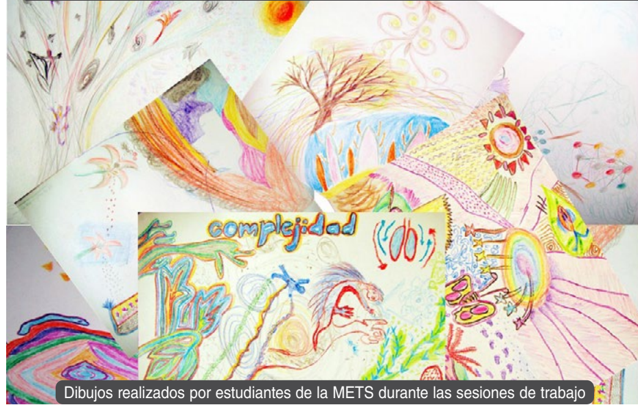
Dibujos realizados por estudiantes de la METS durante las sesiones de trabajo