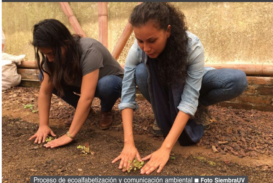
Proceso de ecoalfabetización y comunicación ambiental

llegan a ser tan abrumadores estos datos que pueden conducirnos a la no acción, posiblemente por dos razones: la normalización de estos hechos que nos insensibilizan (así como nos pasa con la violencia en nuestro país) o como consecuencia de que en nuestra percepción el problema es tan grande que ni siquiera vislumbramos por dónde comenzar a resolverlo.