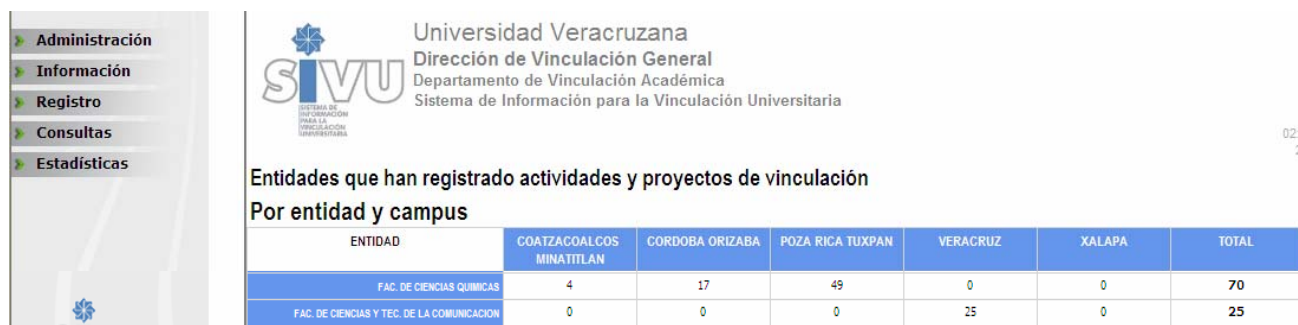
Figura 1. Entidades que han registrado actividades y proyectos de vinculación. Por entidad y campus.