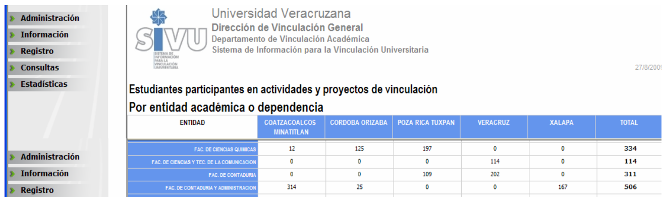
Figura 2 .Estudiantes participantes en actividades y proyectos de vinculación. Por entidad académica o dependencia