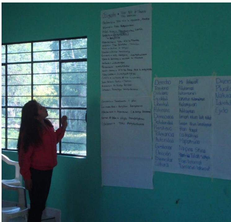
Foto 16. Exposición del ejercicio de terminología sobre conceptos y valores en tutunaku

Más que una reflexión sobre los significados de los valores, por cuestiones de tiempo y de formación lingüística adecuada para profundizar en la semántica del totonaco, se recabó una terminología básica, que nos adentra a las equivalencias de los valores en totonaco, pero que más sin embargo, al ser realizado con el apoyo de abogados totonaco-hablantes en términos jurídicos fue bien intencionado.