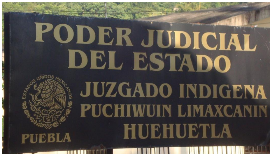
Foto 9. Rotulo aún costado del Juzgado Indígena en Huehuetla

Pero la OIT puso el consejo, una representante de las mujeres, un secretario y empezó a dar talleres sobre derechos.