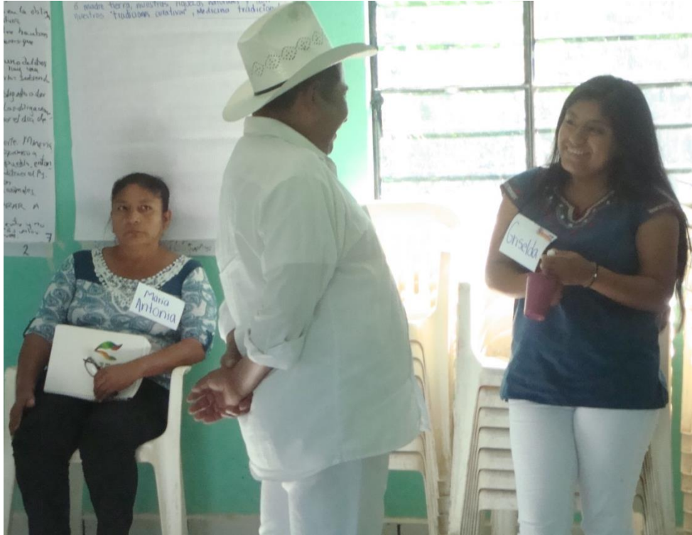
Foto 13. Diálogo entre adultos y jóvenes estudiantes.

7 ¿Nos apoyamos entre vecinos? ¿cuándo, qué y cómo compartimos entre nosotros?