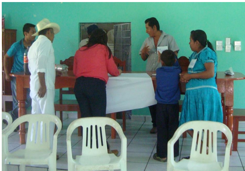
Foto 12. Participación de los asistentes al taller en el análisis de problemáticas