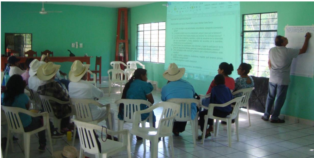
Foto 14. Retomando las participaciones y experiencias de los asistentes.