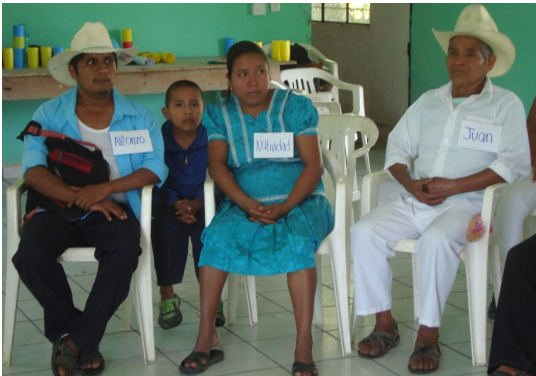
Foto 10. Integrantes de la comunidad de Acatzacatl, asistentes al foro.

¿La comunidad tiene reglas propias para resolver los conflictos internos?