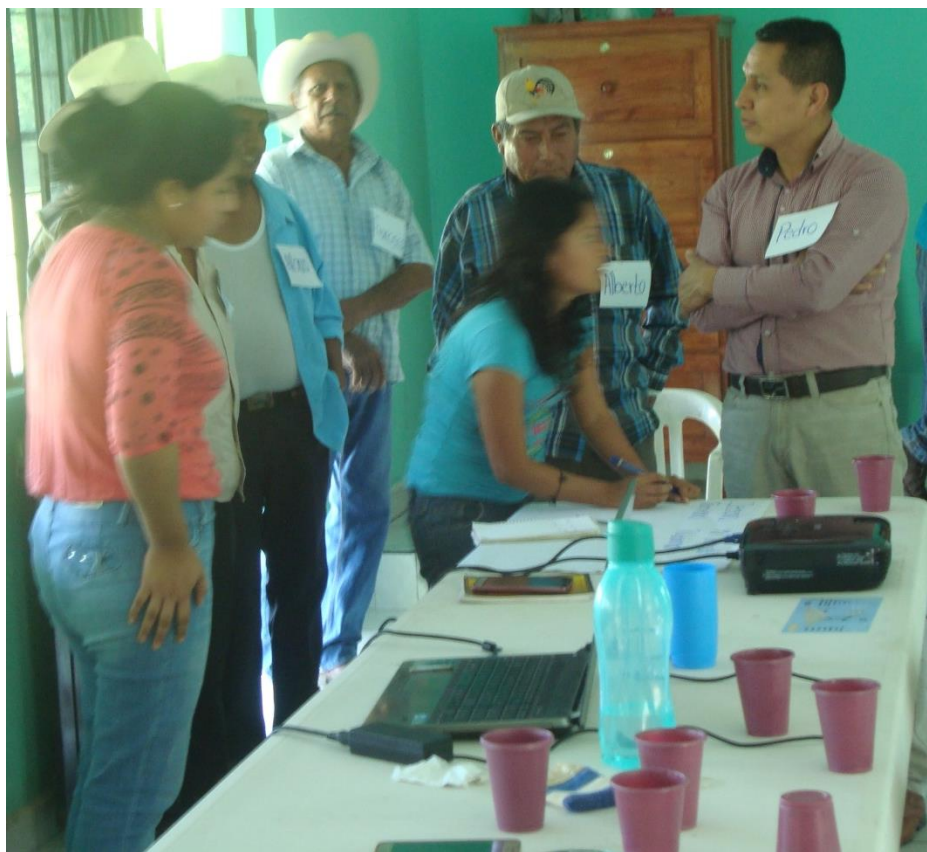
Foto 15. Compartiendo significados de palabras y saberes