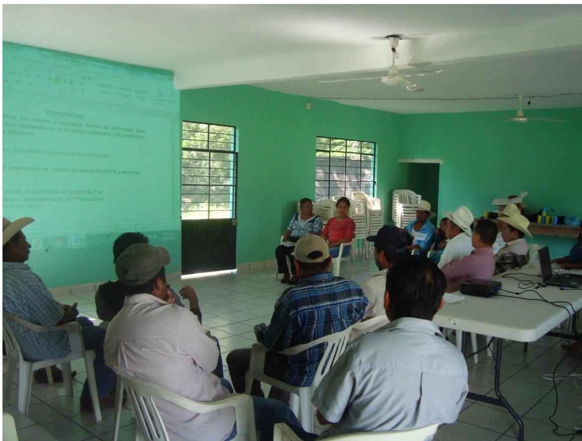
Foto 7. Intercambio de saberes en materia de justicia y derechos

Llego la política, y no se hizo nada, ojala que el nuevo presidente trabaje bien, y se resuelvan los problemas. Cuando se mete la política no se trabaja bien.