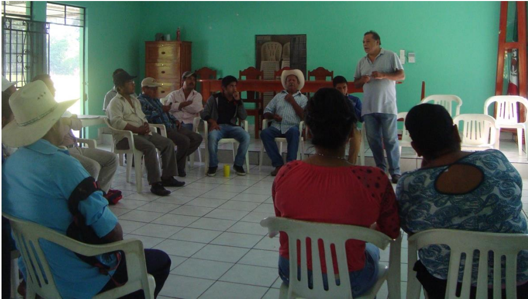
Foto 8. Bienvenida y explicación de la dinámica del taller.

Objetivo: Analizar el desempeño y principios de autoridad, sus competencias y atribuciones, así como las reglas comunitarias y acuerdos que permiten regular, la convivencia en y funcionamiento de la comunidad, además de los valores que guían la actuación de los ciudadanos.