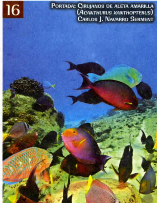
16 PORTADA: CIRUJANOS DE ALETA AMARILLA ( ACANTHURUS XANTHOPTERUS ) CARLOS J. NAVARRO SERMENT