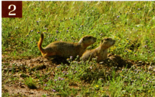
ARCHIVO NATURALIA, A.C.

ESTA ES UNA PUBLICACIÓN COMPROMETIDA CON LA CONSERVACIÓN DE LA NATURALEZA, POR LO QUE LAS PÁGINAS INTERIORES SE IMPRIMEN EN PAPEL 100% RECICLADO RECICLA 100 DE FÁBRICA DE PAPEL SAN JOSÉ, Y LA PORTADA EN CARTULINA ECOLÓGICA LYNX OPAQUE, LIBRE DE ÁCIDO Y CLORO ELEMENTAL, DE GRUPO POCHTECA, LÍNEA DE PAPEL CERTIFICADA POR EL CONSEJO DE MANEJO FORESTAL (FSC) Y POR LA INICIATIVA FORESTAL SUSTENTABLE (SFI).