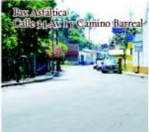
Pav. Asfáltica Calles 9 y Av. 17 Camino Barreal