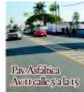
Pav. Asfáltica Av. 11 Calles 5 a la 15