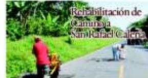
Rehabilitación de Caminaja San Rafael Calería