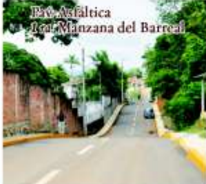
Pav. Asfáltica 1ra. Manzana del Barreal