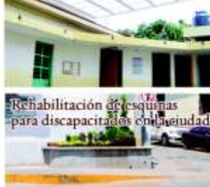
Rehabilitación de esquinas para discapacitados en la ciudad