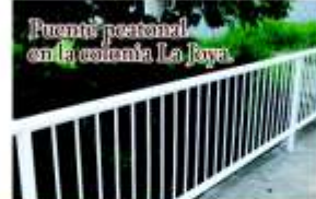
Puente peatonal en la colonia La Joya