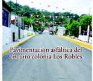
Pavimentación asfáltica del circuito colonia Los Robles