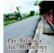
Pav. Asfáltica Tec. Monterrey