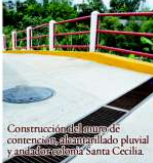
Construcción del muro de contención, albanillado pluvial y andador colonia Santa Cecilia.