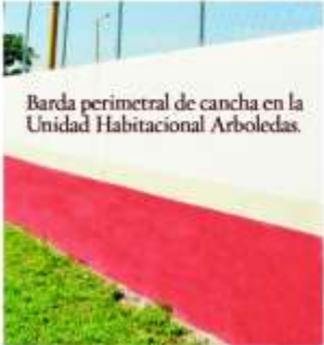
Barda perimetral de cancha en la Unidad Habitacional Arboledas.