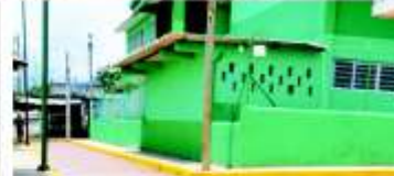
Pavimentación hidráulica en andador José María Morelos y calle 13 de septiembre Colonia Fredepa