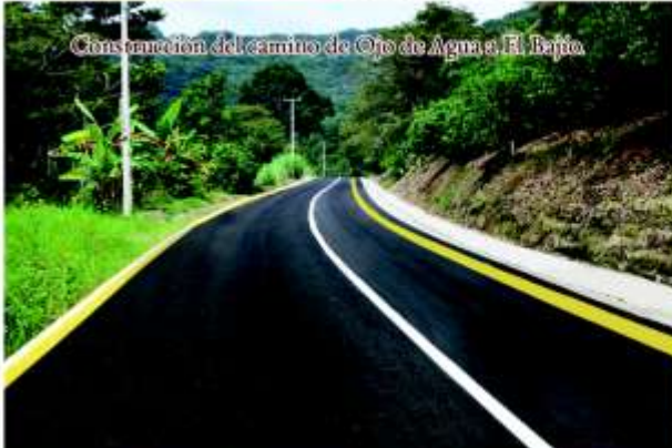
Construcción del camino de Ojo de Agua a El Bajío