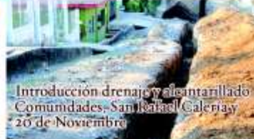
Introducción drenaje y albanillado Comunidades San Rafael Calería y 20 de Noviembre