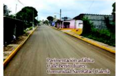
Pavimentación asfáltica Calle Benito Juárez Comunidad San Rafael Calería