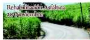
Rehabilitación Asfáltica 20 de Noviembre