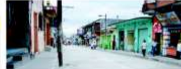
Av. 6 Calles 7 a la 13. Colonia Centro