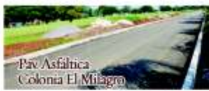
Pav. Asfáltica Colonia El Mitagro