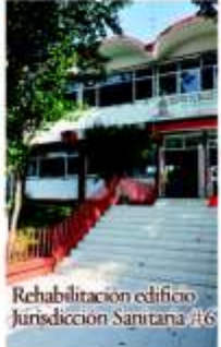
Rehabilitación edificio Jurisdicción Sanitaria #6