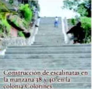
Construcción de escalinatas en la manzana 38 y 40 en la colonia Colorines