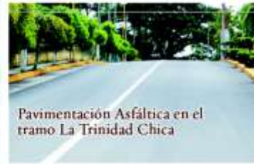
Pavimentación Asfáltica en el tramo La Trinidad Chica