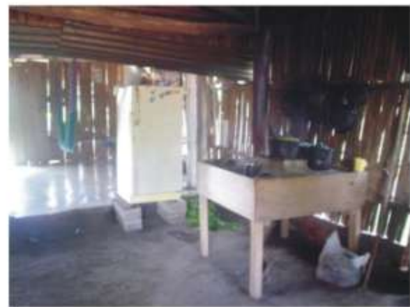
MOBILIARIO -- ENSERES -- SERVICIOS COMUNIDADES DE ESTUDIO EN TIERRA BLANCA, VER.