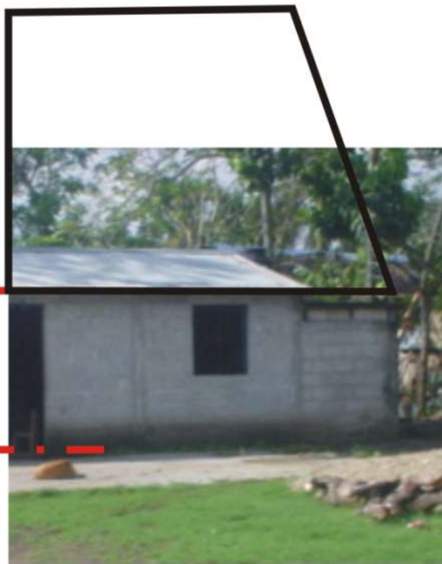
ALTURA DE LA CUBIERTA. CLIMA CÁLIDO TIERRA BLANCA, VER