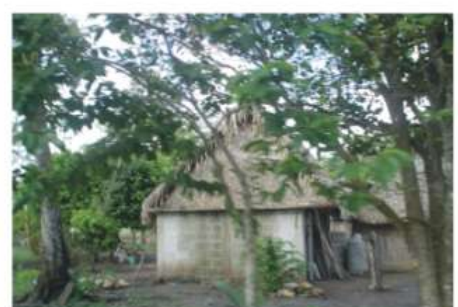
TIPOLOGÍA DE VIVIENDA. EL JOBO, TIERRA BLANCA, VER