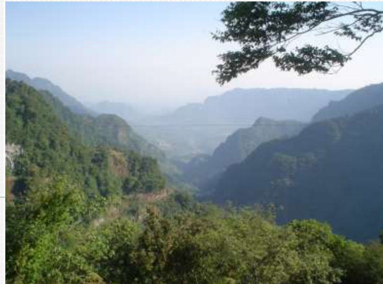
Paisajes naturales alto valor escénico