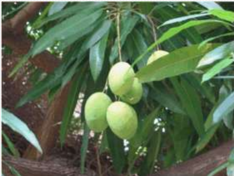
Riqueza natural, tierra fértil