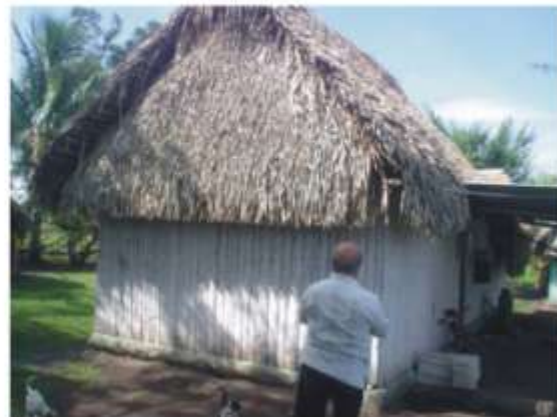
TIPOLOGÍA DE VIVIENDA. San José del Cacao y Emiliano Zapata, TIERRA BLANCA, VER.