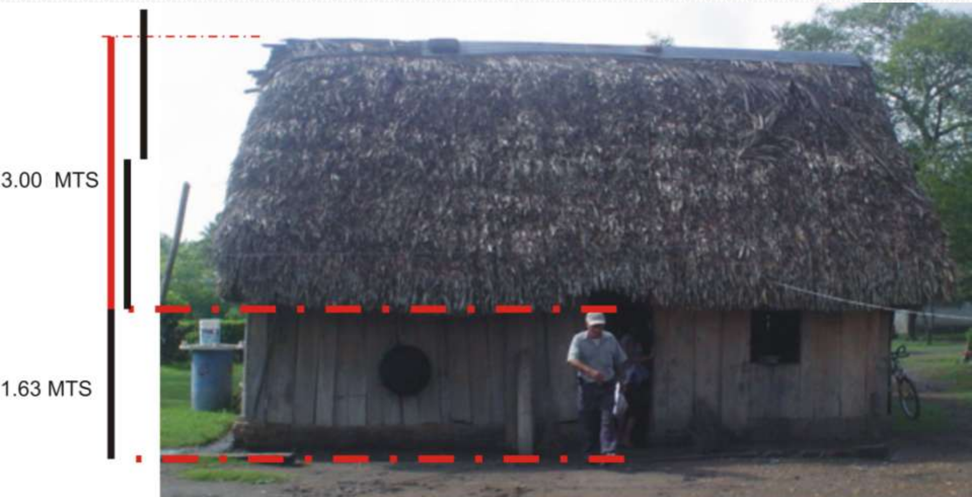
ALTURA DE LA CUBIERTA. CLIMA CÁLIDO TIERRA BLANCA, VER